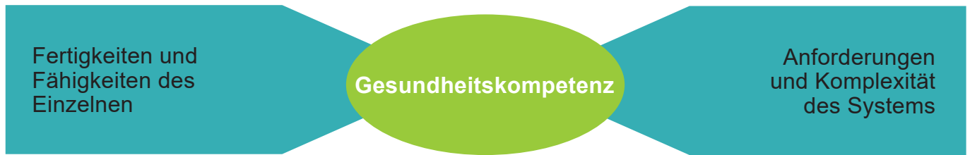
Abbildung 1: Zusammenspiel von persönlicher und systemischer Gesundheitskompetenz [4]