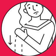
Paralysie dans les bras ou les jambes