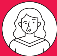
Paralysie au visage