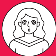
Troubles de la vue