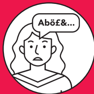
Troubles de la parole