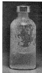
Fig. 3 - Não use este medicamento se partículas no fundo ou na parede derem ao frasco um aspecto fosco (embaçado).

Uso de seringa adequada: as doses de insulina são medidas em unidades . O número de unidades em cada mililitro (mL) está claramente impresso na embalagem. Cada tipo de insulina está disponível na concentração de 100 unidades/mL. É importante entender as graduações na seringa porque o volume a ser injetado depende da concentração, que é o número de unidades por mL. Por esta razão, deve-se utilizar sempre uma seringa graduada para a concentração de insulina. Erro no uso da seringa pode levar a um erro na dose, causando sérios problemas, como variação na glicemia (taxa de glicose no sangue) que pode ser muito baixa ou muito alta.