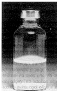
Fig. 1 - Não use este medicamento se o material permanecer no fundo do frasco após a agitação.

Os frascos de HUMULIN 70N/30R devem ser cuidadosamente agitados com movimentos rotativos antes de cada aplicação, de maneira que o conteúdo seja uniformemente misturado. Após agitar suavemente, o conteúdo deve estar turvo ou leitoso. Não usar se, após a agitação, a insulina (material branco) permanecer no fundo do frasco (Fig. 1), se houver grumos (pequenos grãos) suspensos no líquido (Fig. 2), ou se partículas no fundo ou na parede derem ao frasco um aspecto fosco/embaçado (Fig. 3).