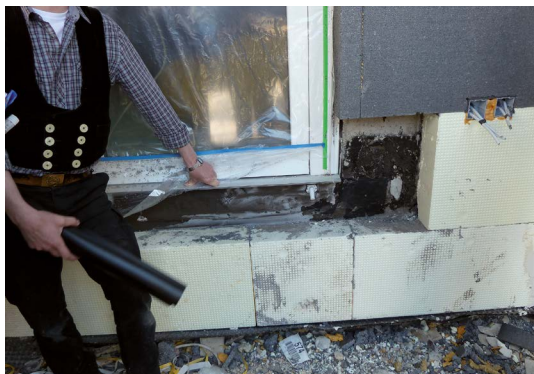
Nicht funktional: Abdichtungsversuch am Türanschluss mit einer Bitumendickbeschichtung. So bitte nicht.

Mit dem Ziel, nachhaltig und mit nachwachsenden Rohstoffen zu bauen, hält der Holzbau in den letzten Jahren immer mehr Einzug im Objektbau. Dies spiegelt sich in den teilweise neu strukturierten Landesbauordnungen wider, die den Holzbau auch in höheren Gebäudeklassen zulassen. Als organischer Werkstoff verzeiht Holz jedoch keine Fehler in Verbindung mit einer Dauerbelastung durch Wasser (rel. Luftfeuchte > 85 %). Schimmelbildung und holzerstörende Pilze sind die Folge. Ein guter Grund, um bei der Abdichtung der Balkonfläche auf Wolfin zu setzen. Als planerische Herausforderung zeigt sich immer wieder die Ausbildung der Anschlüsse im Detail, besonders bei Balkontüren. Die aktuellen Normen und Fachregeln weisen bei Neigungen bis 5° auf eine einzuhaltende Anschlusshöhe von mind. 15 cm ab Oberkante Belag hin, geben jedoch weiteren Spielraum und Vorgaben für die Unterschreitung dieser Anschlusshöhe. Die Oberkante Belag ist die letzte aufgetragene Schicht.