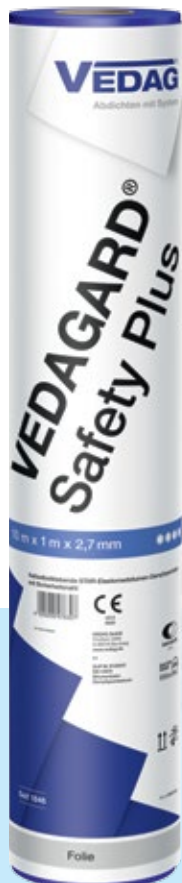
Vedagard Safety Plus Kaltselfstklebende Universal- Dampfsperre in Star-Qualität mit Plus-Oberfläche