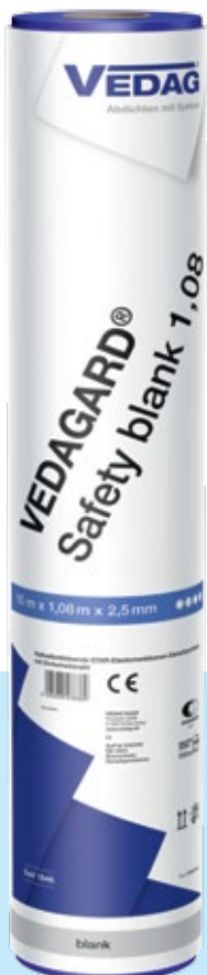
Vedagard Safety blank Kaltselfstklebende Universal- Dampfsperre in Star-Qualität