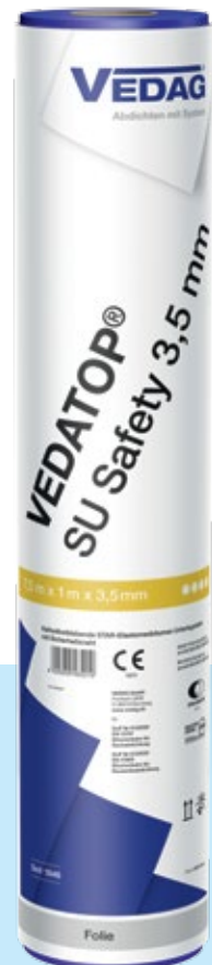
Vedatop SU Safety 3,5 mm Kaltselfstklebende Unterlagsbahn in Star-Qualität