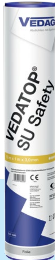
Vedatop SU Safety Kaltselfstklebende Unterlagsbahn in Star-Qualität