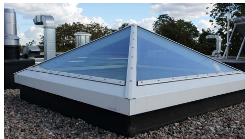
Lässt Sonnenlicht herein, aber kein Wasser: Pyramiden-Lichtkuppel.