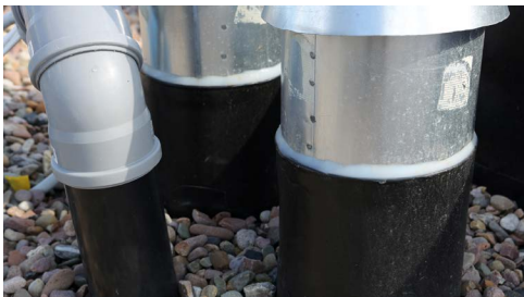
Diffizile Detailarbeit: handgefertigte Manschetten für die Rohre.