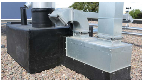
Haustechnik auf dem Dach: Abdichtungsarbeit für Profis und Profi-Material.