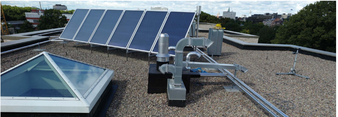
MERIDIAN-Dach: sicher gegen Wasser dank Wolfin GWSK.

2012 konnten die 54 Wohnungen bezogen werden. 2013 folgte schließlich an derselben Straße die Fertigstellung der Mehrfamilienhäuser NAUTICO, PENINSULA und LAGUNA mit jeweils 27 Wohneinheiten. Alle Entwürfe sind Ergebnis von nationalen und internationalen Architektenwettbewerben. So unterschiedlich die vier- bis fünfgeschossigen Wohnanlagen auch in der äußeren Architektur sind – offensichtlich sind der ambitionierte Gestaltungswille und die durchgängig hochwertige Ausführung und Ausstattung bis ins Detail. So auch bei der Abdichtung. Hier fiel die Wahl zum einen auf die Hochwert-Kunststoff-Dach- und -Dichtungsbahn Wolfin. Und zum anderen auf das renommierte Dachdeckungsgeschäft Helmut Kröff GmbH & Co. KG, das seit mehr als 200 Jahren mit heute über 30 Mitarbeitern in ganz Norddeutschland tätig ist ( www.kroeff.de ).