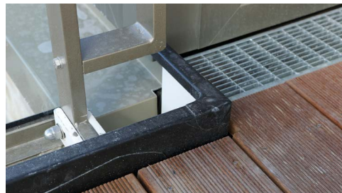
Sicherer Abfluss, sichere Abdichtung.