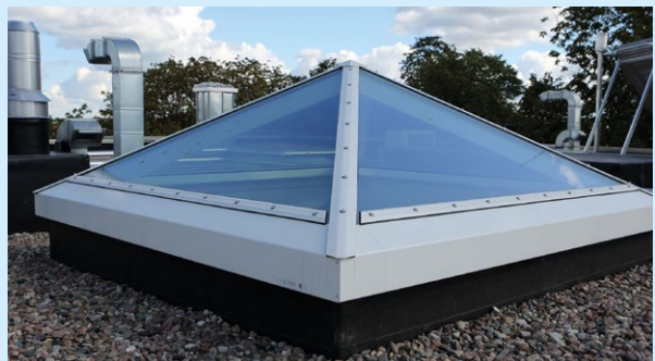
Lässt Sonnenlicht herein, aber kein Wasser: Pyramiden-Lichtkuppel.