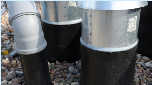
Diffizile Detailarbeit: handgefertigte Manschetten für die Rohre.