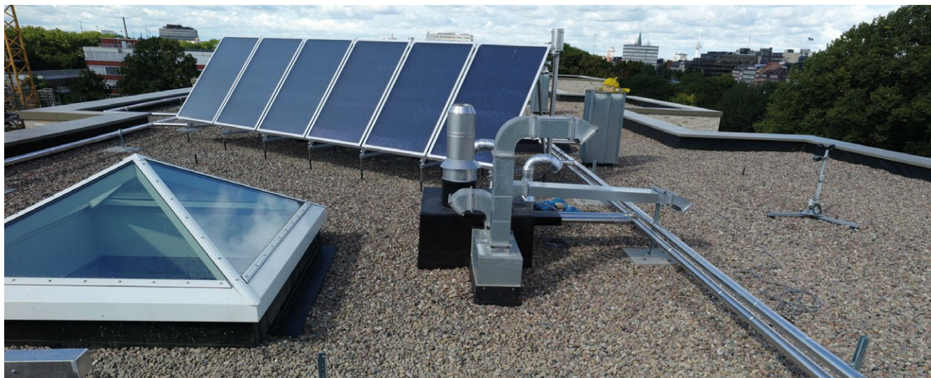
MERIDIAN-Dach: sicher gegen Wasser dank Wolfin GWSK.

2012 konnten die 54 Wohnungen bezogen werden. 2013 folgte schließlich an derselben Straße die Fertigstellung der Mehrfamilienhäuser NAUTICO, PENINSULA und LAGUNA mit jeweils 27 Wohneinheiten. Alle Entwürfe sind Ergebnis von nationalen und internationalen Architektenwettbewerben. So unterschiedlich die vier- bis fünfgeschossigen Wohnanlagen auch in der äußeren Architektur sind – offensichtlich sind der ambitionierte Gestaltungswille und die durchgängig hochwertige Ausführung und Ausstattung bis ins Detail. So auch bei der Abdichtung. Hier fiel die Wahl zum einen auf die Hochwert-Kunststoff-Dach- und -Dichtungsbahn Wolfin. Und zum anderen auf das renommierte Dachdeckungsgeschäft Helmut Kröff GmbH & Co. KG, das seit mehr als 200 Jahren mit heute über 30 Mitarbeitern in ganz Norddeutschland tätig ist ( www.kroeff.de ).