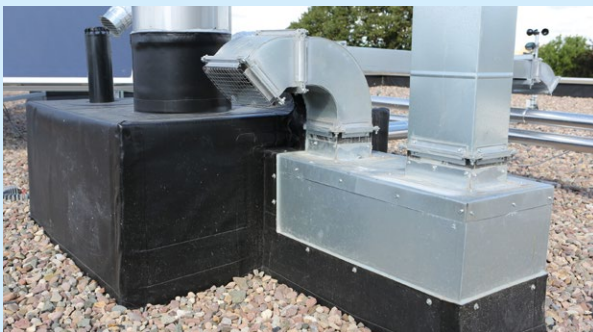
Haustechnik auf dem Dach: Abdichtungsarbeit für Profis und Profi-Material.