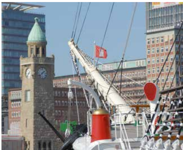
Landungsbrücken St. Pauli mit dem Hard Rock Cafe: ein Besuchermagnet ersten Ranges.

Seit über 55 Jahren produziert unser Unternehmen Kunststoff-Dach- und Dichtungsbahnen für Flachdach und Bauwerksabdichtungen.