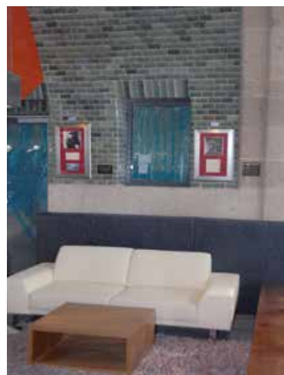
Entspannen im Rockambiente.