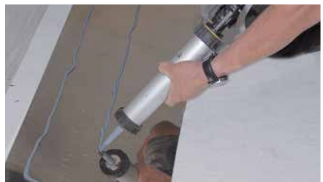
Zur Verklebung der Verbundblechprofile wird rückseitig Wolfinator Montageklebstoff aufgebracht.