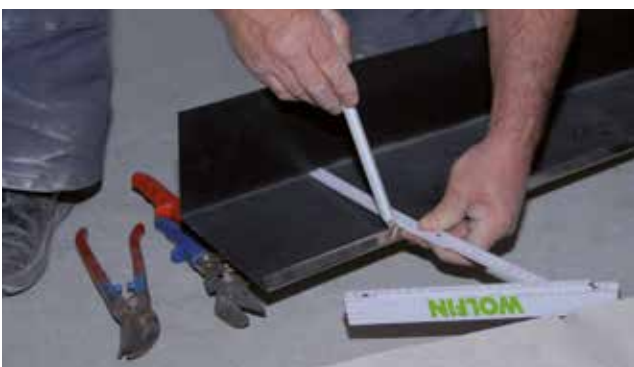
Sorgfalt beginnt bei der Vorbereitung: Zuschchnitt und Montage der Wolfin Edelstahl-Verbundblechelemente.

An eine professionelle Abdichtung von gewerblichen Küchen gemäß DIN 18534 "Abdichtung von Innenräumen" werden extrem hohe Anforderungen gestellt. Erstens muss sie natürlich eine lückenlos dichte Wanne bilden. Zweitens darf sie nicht starr mit dem Untergrund verbunden sein, um Bewegungen auszugleichen. Drittens muss sie in höchstem Maße chemikalienbeständig sein. Man könnte auch sagen: Es muss eine Wolfin Bahn sein. Denn Wolfin Kunststoff-Dach- und -Dichtungsbahnen werden seit über 55 Jahren nicht nur auf dem Flachdach eingesetzt, sondern auch immer dort, wo besondere Anforderungen an die Chemikalienbeständigkeit gestellt werden. Zum Beispiel auch bei gewerblich genutzten Küchen.