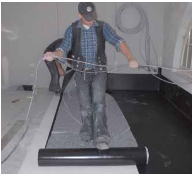
Entscheidend: die Abdichtungslage Wolfin IB, im Nahtbereich quellverschweißt.

Wolfin Bahnen sind beständig gegen Öle, Fette oder die hochaggressive Milchsäure, aber auch gegen die eingesetzten professionellen Reinigungs-, Pflege- und Desinfektionsmittel. Deshalb waren sich Planer, Bauherr und Ausführende beim Hard Rock Cafe schnell einig: Die Küche erhält eine Hochwertabdichtung aus Wolfin IB.