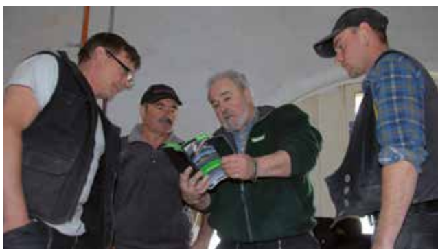
Teil der Wolfin Dienstleistung: Einweisung vor Ort.

Im ersten Schritt wurden auf dem verlegereifen Fließestrichuntergrund als Trenn- und Schutzlage ein Witec Schutzvlies 300g/m 2 ausgelegt und für die Anschlüsse an die Wände Wolfin Edelstahl-Verbundblechelemente zugeschnitten und gekantet. Als Mindestanschlusshöhe gilt hier 15 cm über Oberkante Belag. Zur Verklebung der Verbundbleche wurde rückseitig der Montageklebstoff Wolfinator aufgebracht. So verklebt mussten die Edelstahl-Verbundbleche über Dübel und Schrauben nur noch an den Profildenden verankert werden. Die Profilstöße wurden mit einem Kreppband abgeklebt und mit einem Heißluftfön mit Wolfin IB Streifen überschweißt. Der Übergang zwischen Verbundblechprofil und Wandfläche erfolgte nach einem Primeranstrich mit