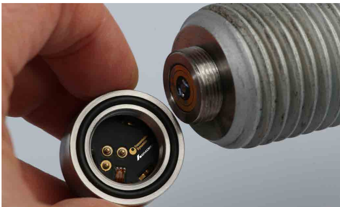
LMF+ funciona con el módulo Bolt Cap Module® de Transmisión Dinámica

Un historial de éxitos. LMF+ garantiza que su hardware crítico no solo se instala correctamente, sino que también mejora la fiabilidad operativa mientras está en servicio.