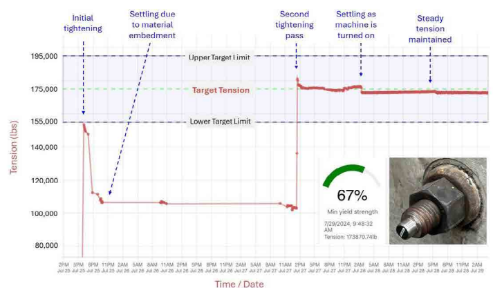
Gráfico de la tensión de los pernos en función del tiempo

Fijación con Control de Carga Plus (LMF+) es un sistema de control de tensión de elementos de fijación inalámbrico, preciso y automático. El LMF+ es extremadamente fácil de usar y permitirá a los usuarios observar y registrar continuamente la tensión real de los elementos de fijación, tanto durante la instalación como mientras el conjunto está en funcionamiento. Las alertas automáticas le notificarán si la tensión se desvía de los valores deseados.