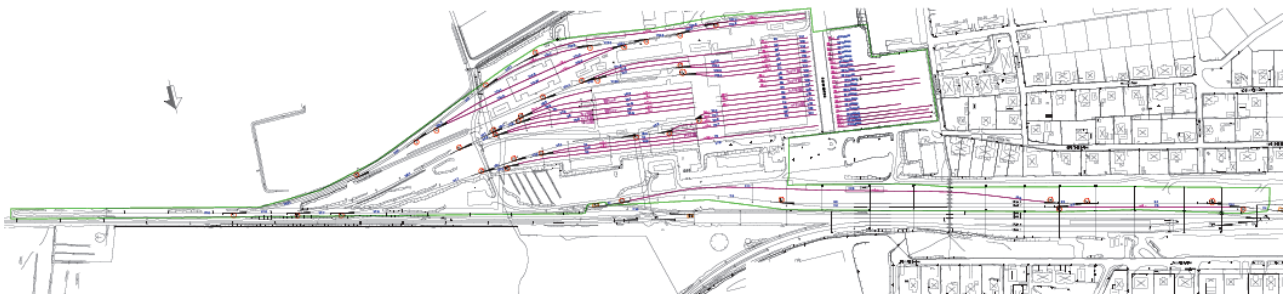
Fig. Samordningsområde Tillberga depå.

Området innanför den gröna markeringen ingår i samordningsområdet.