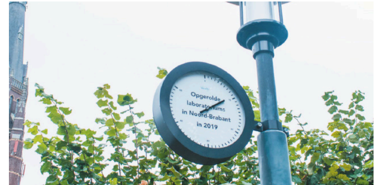
Figuur 3: Klokkenuider, Studio Daan Wubben

Het initiatief is door de World Design Embassies opgezet. Bij deze cross-over waren 5 ontwerpers 7 en 5 gemeenten 8 betrokken. De Dutch Design Week was het platform om de