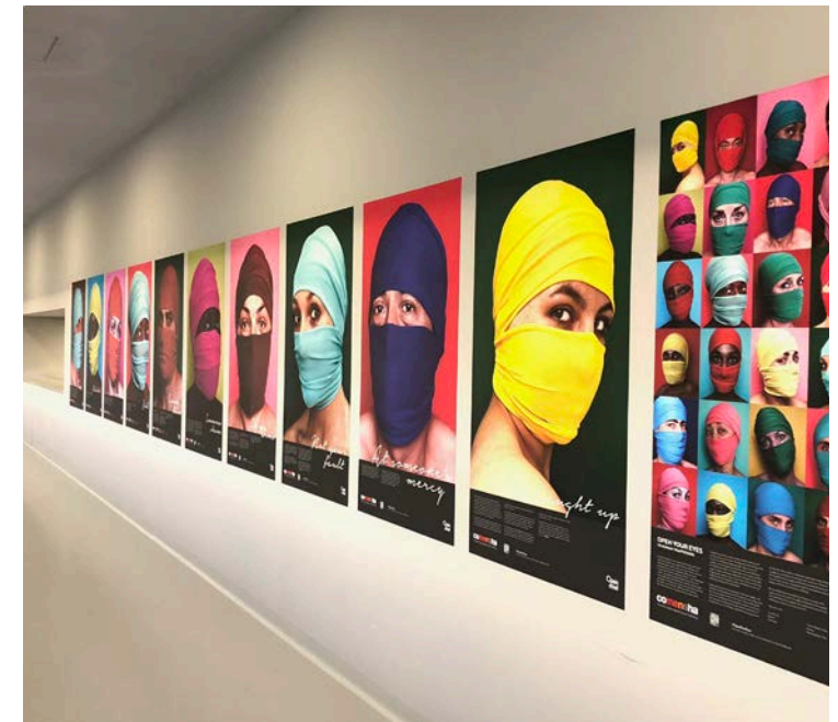
Figuur 4: Expositie 'open je ogen'

De rol van design in deze samenwerking is daarmee het vormgeven aan deze kennis voor de bewustwordingscampagne, en het faciliteren van een dialoog over het onderwerp. Dit laat een vrij klassieke cross-over zien tussen de veiligheidssector en de creatieve professionals.