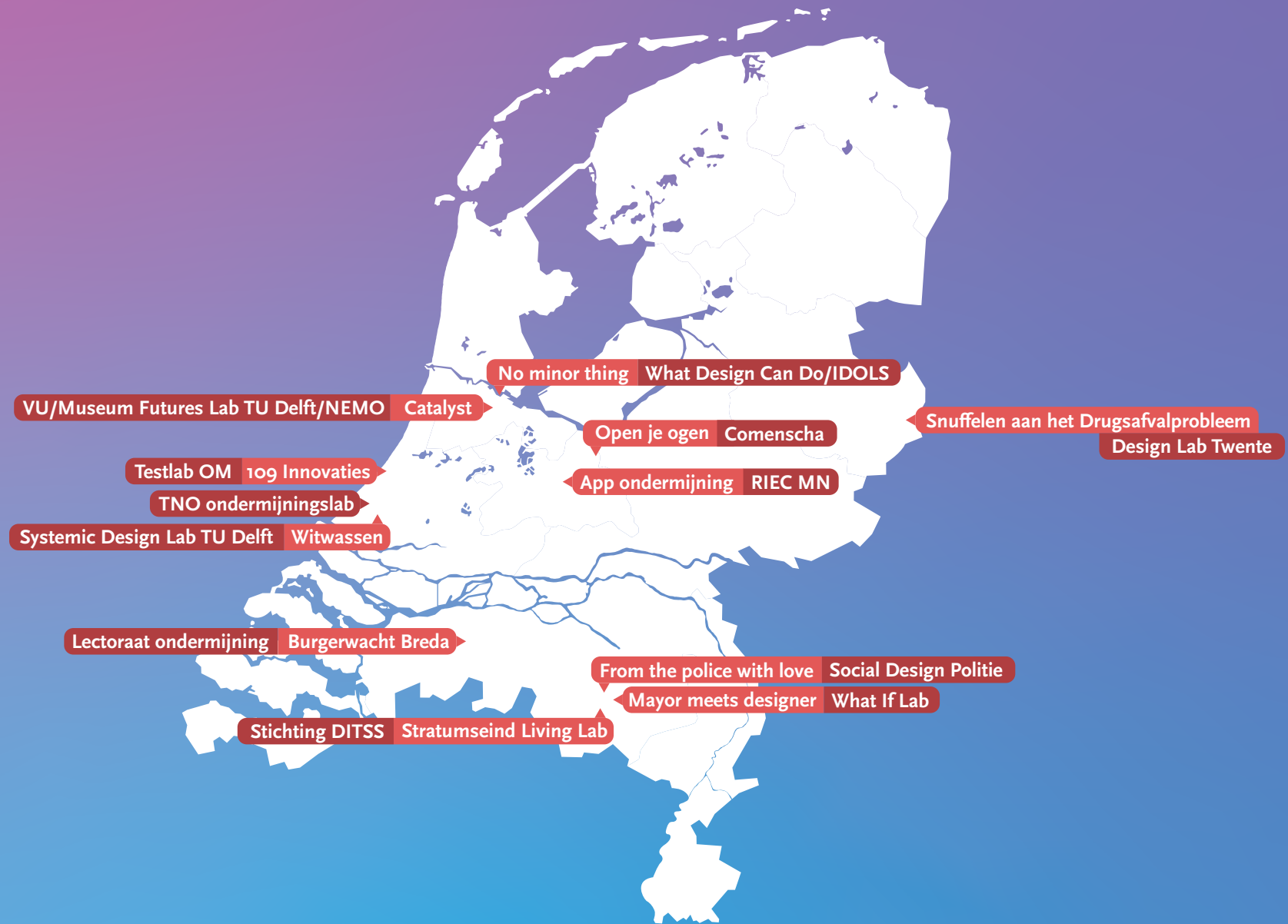
Figuur 1: een geografisch overzicht van de geanalyseerde projecten en kernorganisatoren