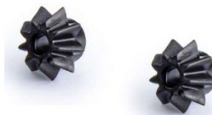
PI429o15-bg (cónico plástico para motor k)