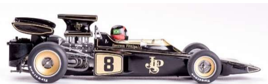
CAR02c Lotus 72 Monaco 1972