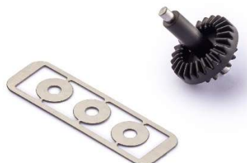
PGI2516-bg (para piñón cónico)