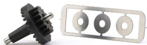
PGI2516-PI (para piñón latón)