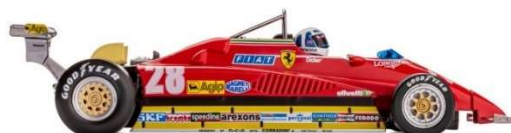
CAR09a Ferrari 126 C2 Long Beach GP 1982