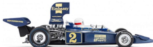
Llantas traseras 13,8 x 13,5 mm