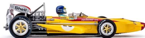
CAR04c March 701 Monaco 1970