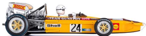
CAR04e March 701 Kyalami 1971