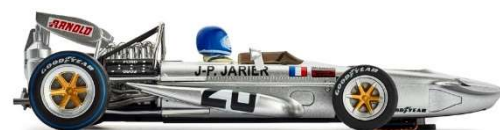
CAR04d March 701 Monza 1971