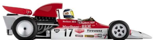
CAR08b BRM P160 Monaco 1972