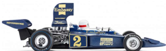
CAR02f Lotus 72D Kyalami 1975