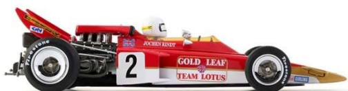
CAR02a Lotus 72 German GP 1970