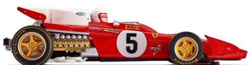
CAR05b Ferrari 312 B2 Silverstone 1971