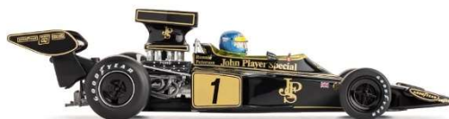
CAR02g Lotus 72E Monaco 1974