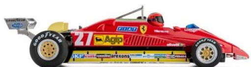
PCW1 Ferrari 126 C2 Zolder GP 1982