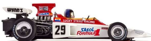
CAR02e Brands Hatch 1972