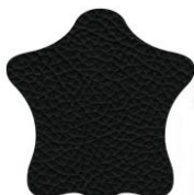
KAB кожа черный