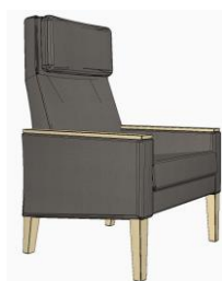
Обитые тканью с деревянной планкой