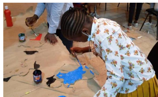
Marionetten knutselen in Kinshasa, 2021