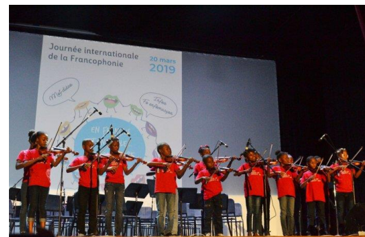
Muzikaal concert in Haïti, 2019