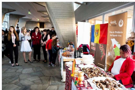
Markt met etenswaren in Parijs, 2019