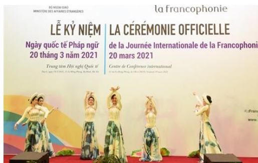
Traditionele dans in Hanoï, 2021