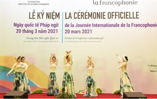
Traditionele dans in Hanoi, 2021

D Regarde les photos. Je ziet hoe La journée de la francophonie in de afgelopen jaren gevierd werd in verschillende gebieden.