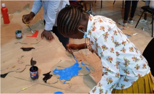
Marionetten knutselen in Kinshasa, 2021