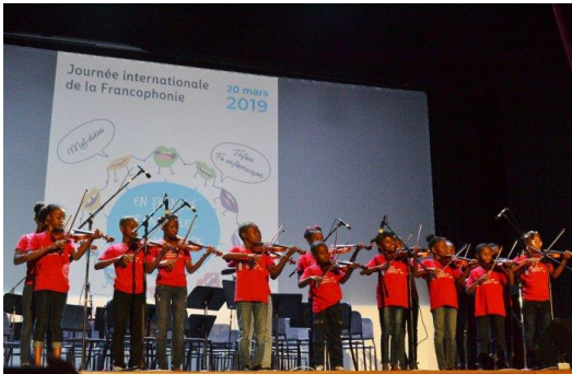
Muzikaal concert in Haïti, 2019

Wat vind jij de beste manier om een taal te vieren? Noteer welke elementen jij terug zou laten komen in de viering van een taal. Dat mag het Nederlands zijn, het Frans of een andere taal die je spreekt.