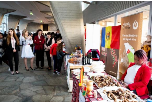
Markt met etenswaren in Parijs, 2019