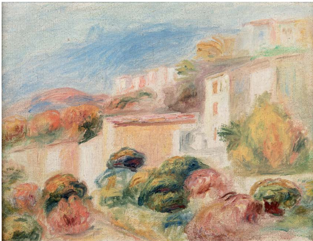
Pierre-Auguste RENOIR (1841 - 1919) Paysage de Cagnes , vers 1905 Huile sur toile, 25 x 31,5 cm

Provenance : Collection particulière, Collection particulière, Suisse.