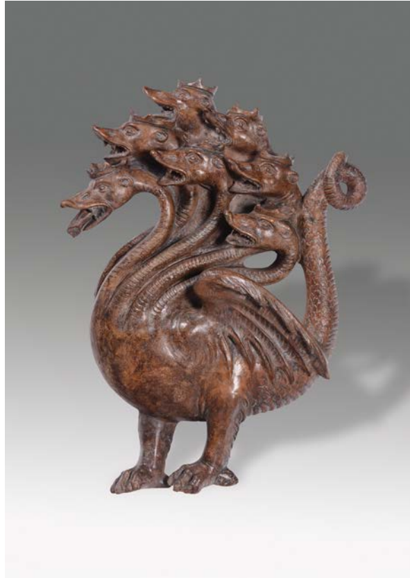
Dragon de l'Apocalypse, première moitié du XVI e siècle Terracotta 65 x 46 x 11.5 cm

Provenance : Importante collection privée, Florence.