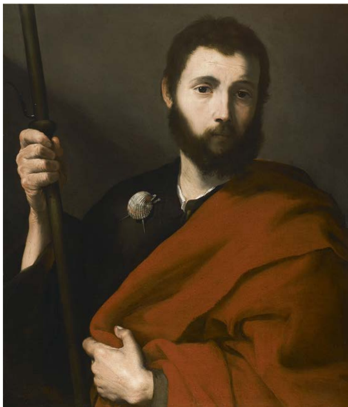
Jusepe de RIBERA (Jativa, 1591 - Naples, 1652) Saint Jacques le Majeur Huile sur toile, 74 x 64 cm

Provenance : Londres, Galerie Helikon ; collection particulière.