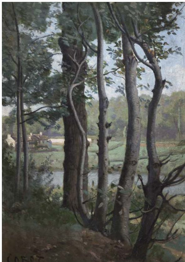
Jean-Baptiste Camille COROT (1796 - 1875) Les Eaux, près Château-Thierry, chemin bordé d'arbres, vers 1855-1865 Huile sur toile, H. 0,40 m ; L. 0,28 m Signée : Corot