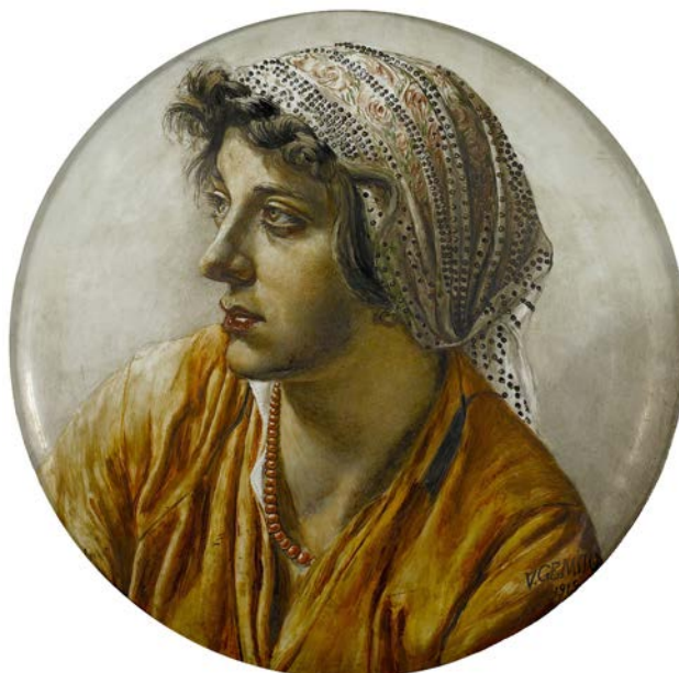
Vincenzo GEMITO (Naples 1852 - 1929) Le portrait d'une Jeune Femme Portant un Collier de Corail , 1915 Tempera et or sur assiette en céramique Signé and daté en bas à droite : V. GEMITO 1915 Diamètre : 42.5 cm