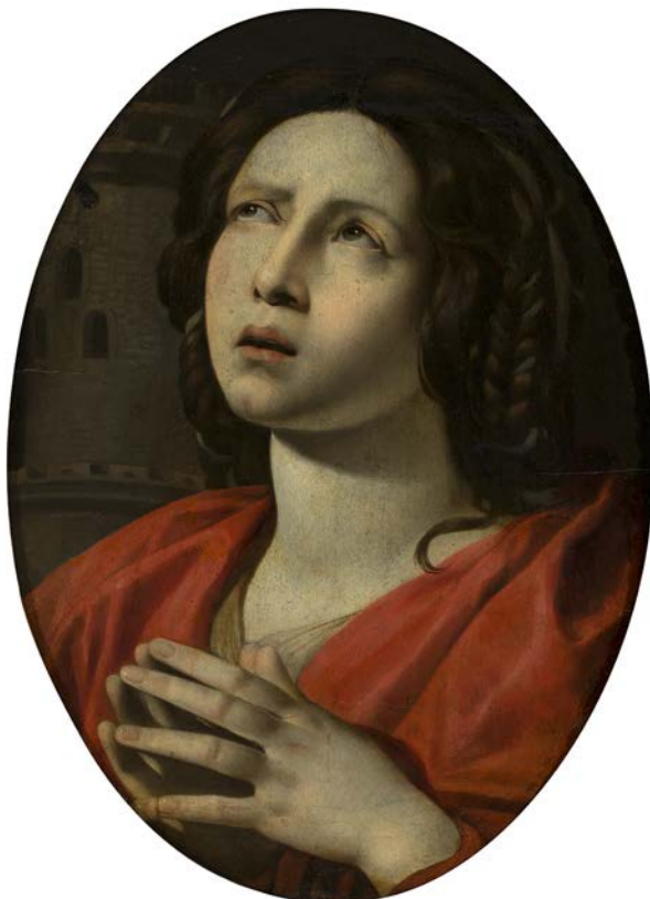
Giovanni Battista CARACCIOLO, dit BATTISTELLO (Naples, 1578 - 1635) Sainte Barbara , c. 1633 Huile sur toile 53 x 39 cm