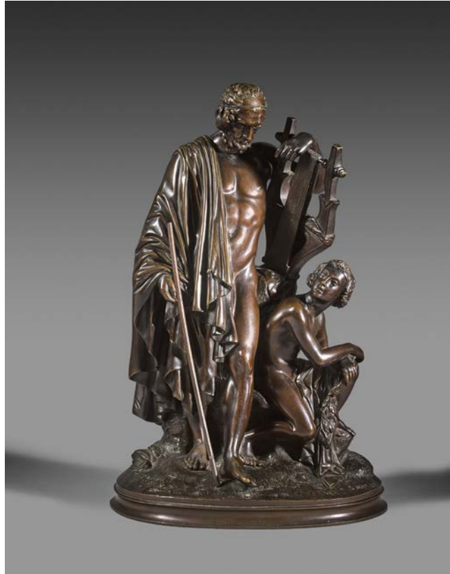
James PRADIER (1790 - 1852) Homère et son guide , Milieu du XIX e siècle Bronze, H : 42,5 cm Signé « J Pradier » Inscription SM