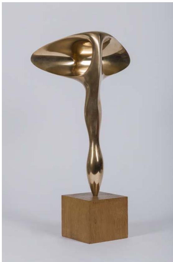
Antoine PONCET (1928-) L'oreille à reflets , 1959 Bronze poli sur socle en bois 46,5 x 30 cm