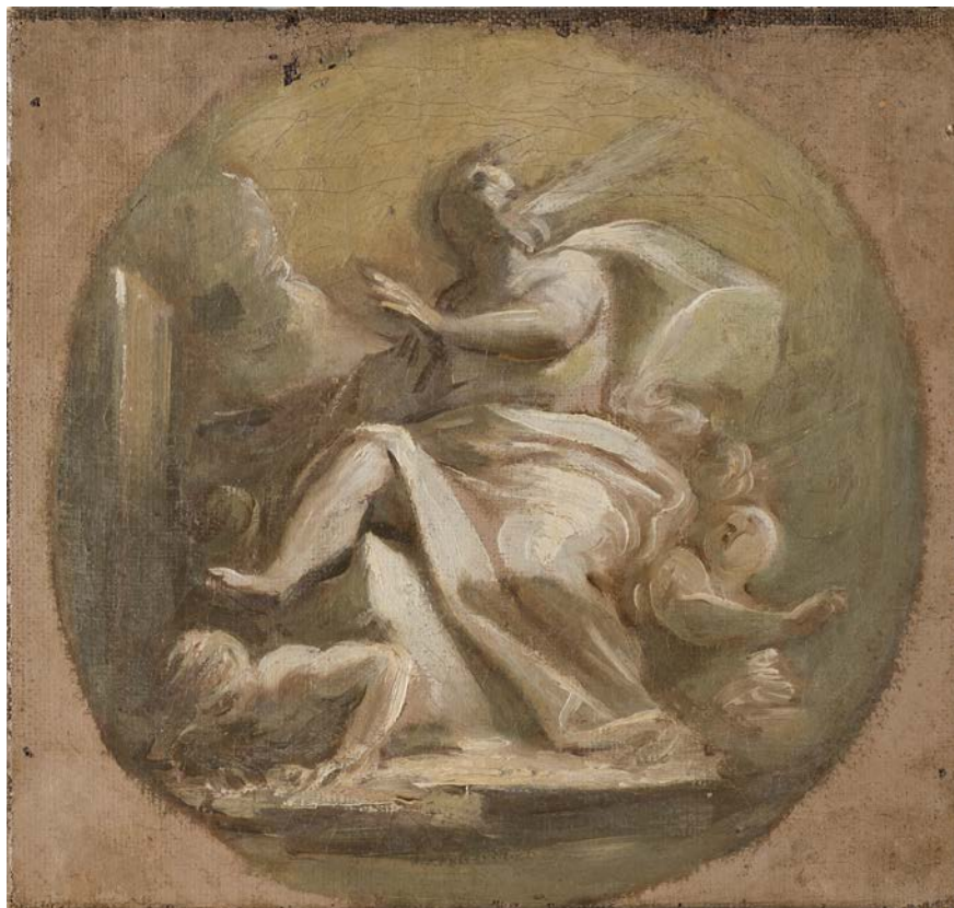
Mariano SALVADOR MAELLA (1739-1819) Aeolus , 1795 - 1796 Huile sur toile, 18,5 x 20 cm

Esquisse pour l'un des quatre coins tonde de la fresque L'Apothéose d'Hadrien, voûte peinte par Maella en 1795-1796 pour le Palais Royal de Madrid.