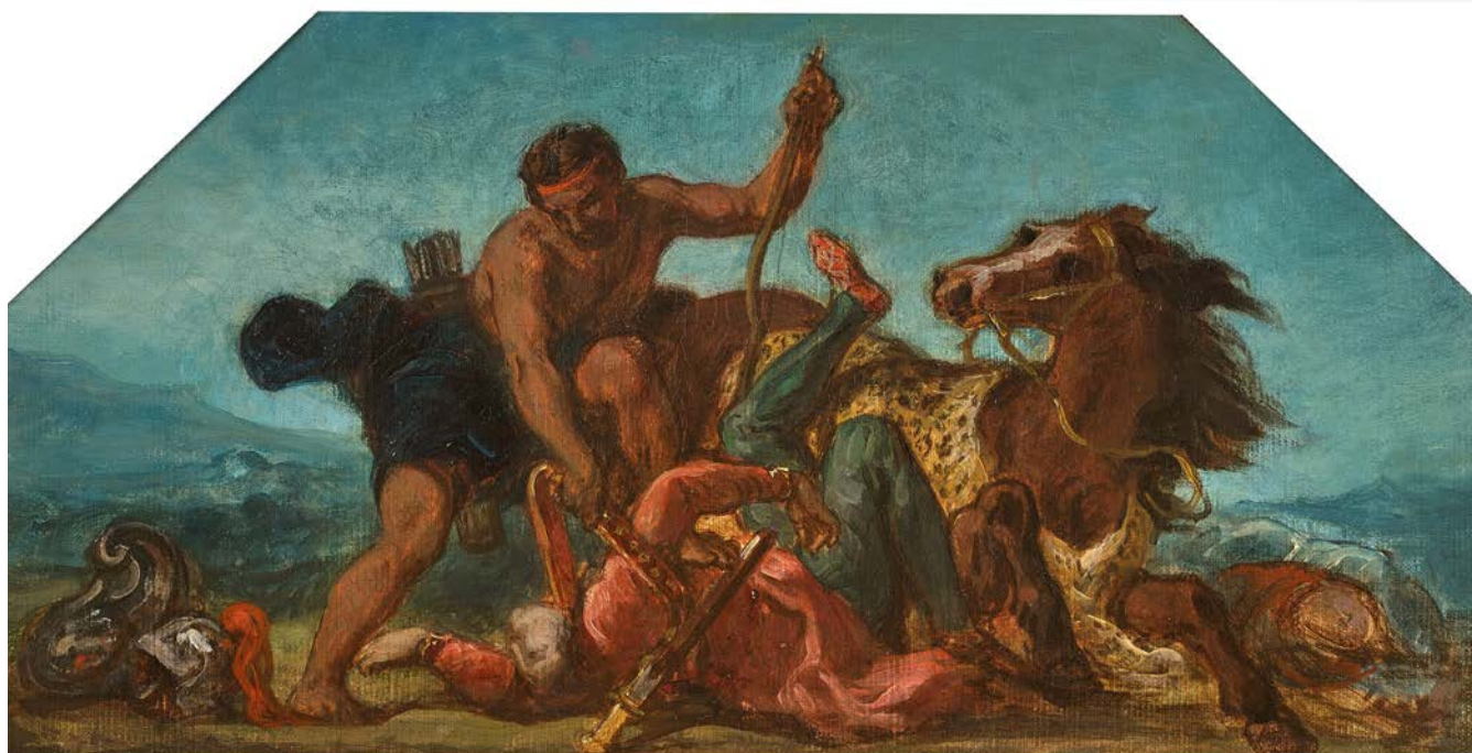
Ferdinand-Victor-Eugène DELACROIX (Charenton-Saint-Maurice 1798 - Paris 1863) Hercule s'empare du baudrier d'Hippolyte, reine des Amazones, esquisse Huile sur toile, 24,5x47,5 cm