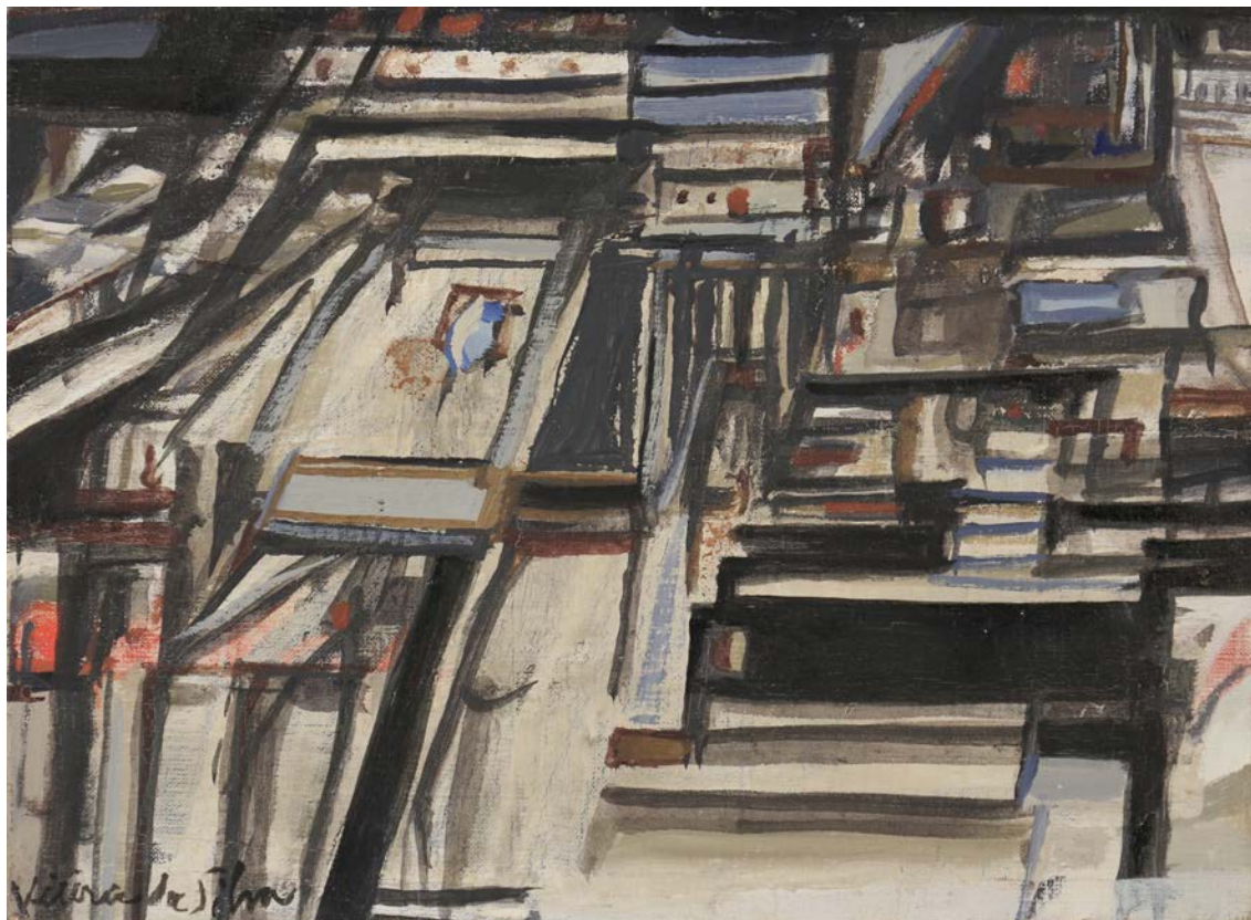
Maria Helena VIEIRA DA SILVA (1908 - 1992)