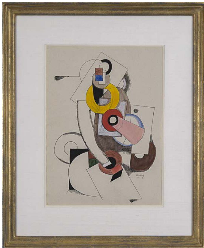
Joseph CSAKY Composition Cubiste, 1919 Encre de Chine et aquarelle sur papier 13.4 x 10 in