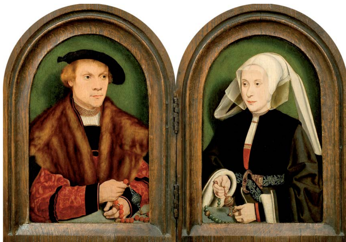
Bartholomeus BRUYN LE VIEUX (vers 1493 Cologne ou Wesel - Cologne 1553 - 1557) Portrait-diptyque d'un couple bourgeois, probablement de Cologne, avec au verso la représentation d'un memento-mori Panneau : 31 x 20,6 cm ; verso 38,8 x 30,8 cm