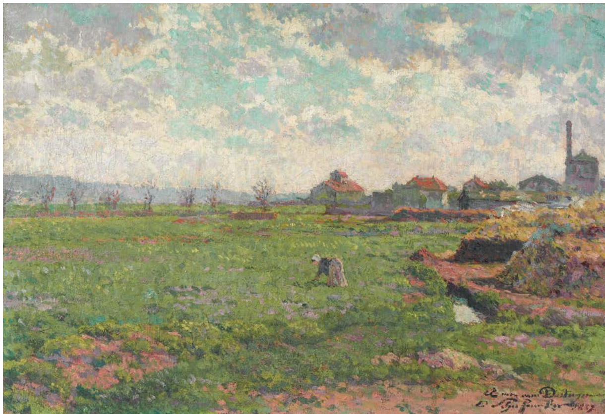
Claude-Émile SCHUFFENECKER (Fresne-Saint-Mamès, 1851 - Paris, 1934) Vue de banlieue , 1887