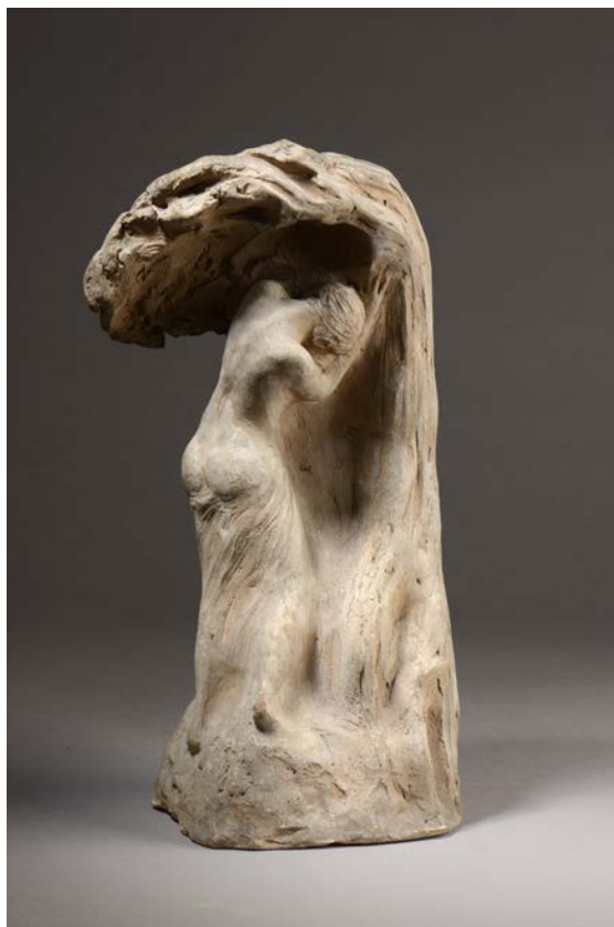
Carl WILHELM WALLGREN, dit VILLE VALLGREN (1855-1940) La Vague , Circa 1893 Terre cuite originale, 32 x 13,5 x 11,5 cm Signée «Vallgren» sur la base