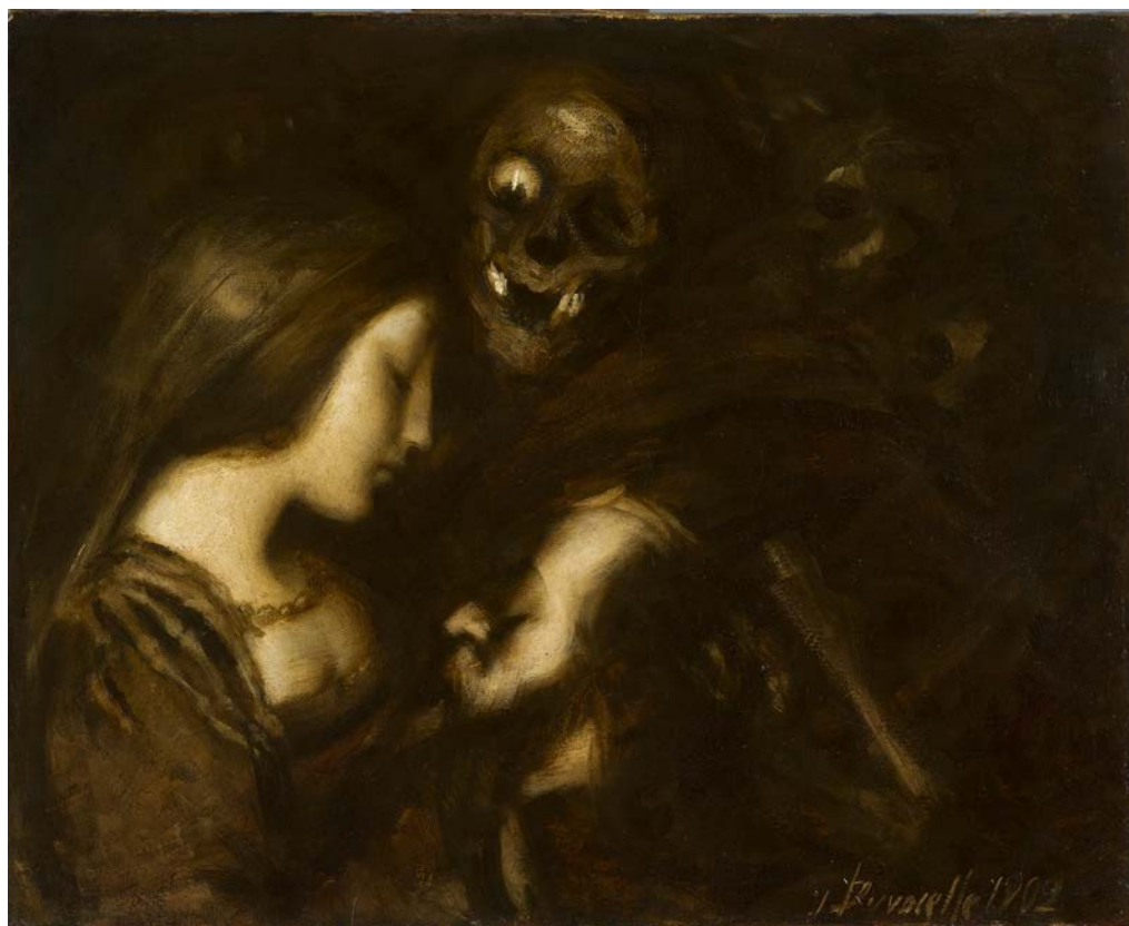
Julien Adolphe DUVOCELLE (Lille, 1873 - Corbeil-Essonnes, 1961)