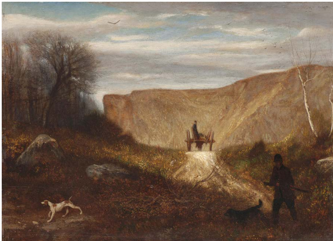
Alexandre Gabriel DECAMPS (Paris 1803 – 1860 Fontainebleau)

Sablonnière dans la forêt de Fontainebleau, c. 1858