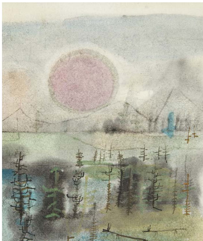
Zao WOU KI (1920-2013) Sans titre , env. 1950 Aquarelle et encre sur papier, 14 x 13 cm Signature en bas à droite