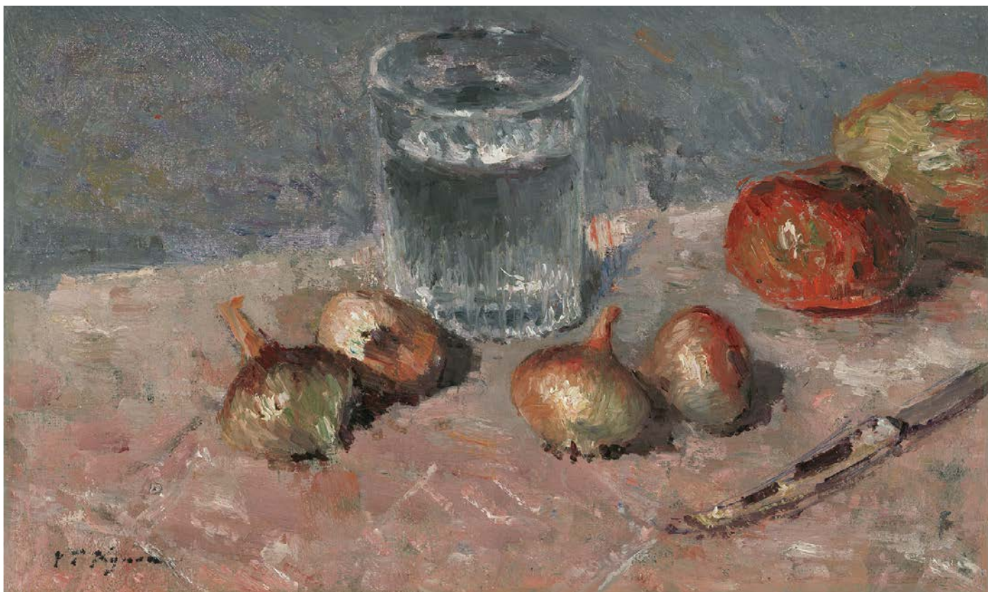
Victor VIGNON (1847 Villers-Cotterêts - Meulan-en-Yvelines 1909)