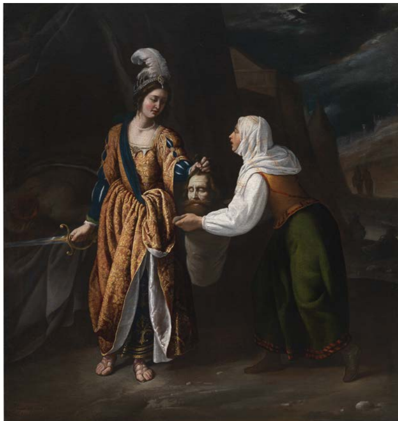
Pedro NÚÑEZ DEL VALLE (Madrid, dernière décennie du XVI e siècle - 1649)