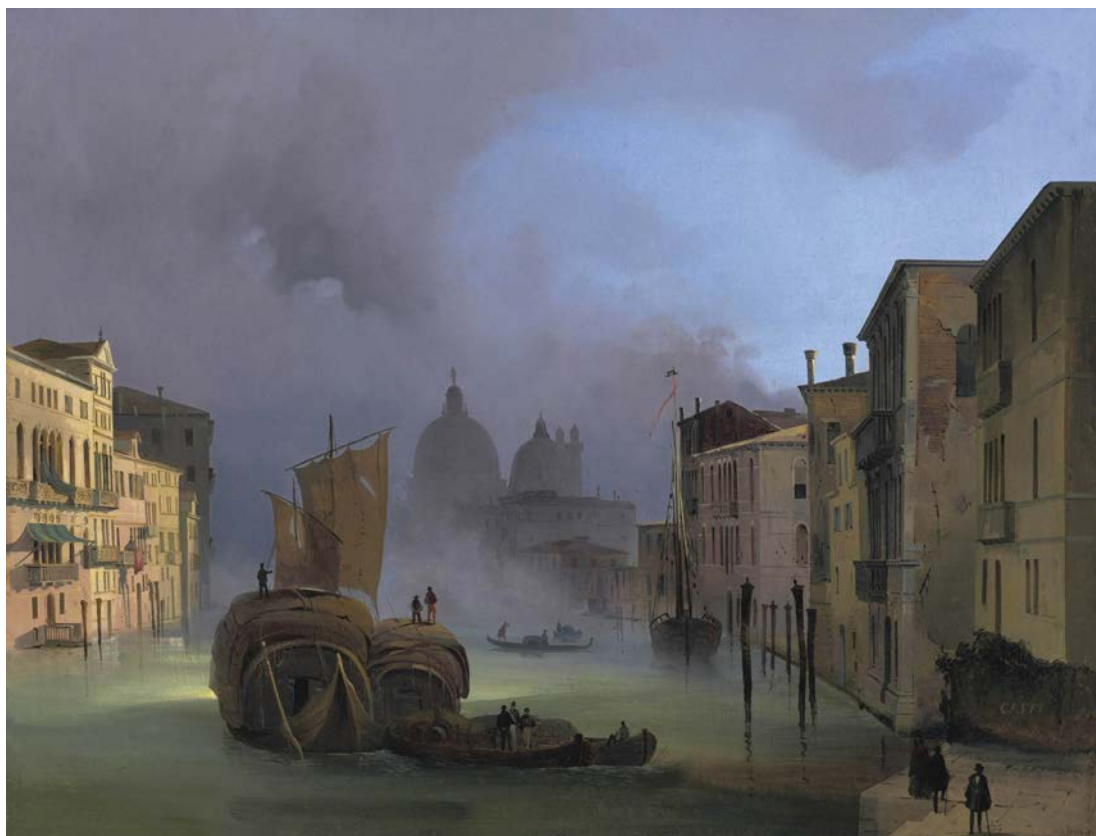
Ippolito CAFFI (Belluno 1809 - Bataille de Lissa 1866) Le Grand Canal de Venise devant la basilique Santa Maria della Salute, c. 1842 Huile sur toile, 47 x 60.9 cm Signature en bas à droite : CAFFI