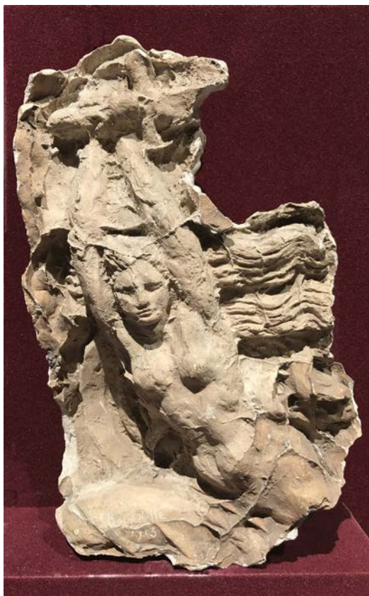
Antoine BOURDELLE (1861 - 1929) L'Épopée polonaise , 1913 Signé et daté en bas : Bourdelle / 1913 Plâtre patiné, Hauteur : 25 cm