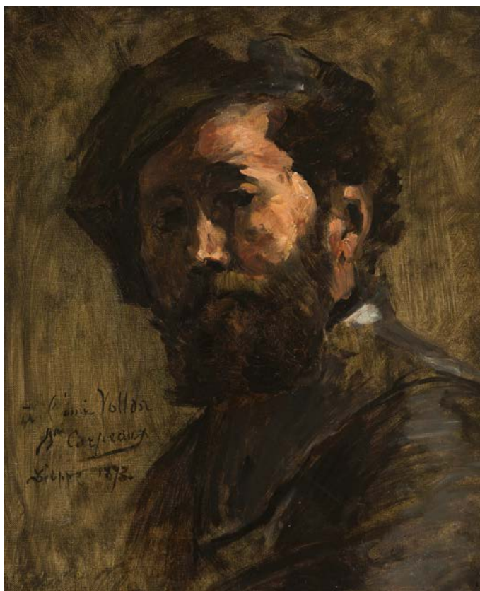
Jean-Baptiste CARPEAUX 1827 - 1875) Portrait d'Antoine Vollon (1833 - 1900), 1873 Signé, daté et inscrit, centre-gauche, à l'ami Vollon/ Bte Carpeaux/Dieppe 1873 L'huile sur toile montée, 17 3/8 x 14 1/4 inches 44.2 x 36.2 cm