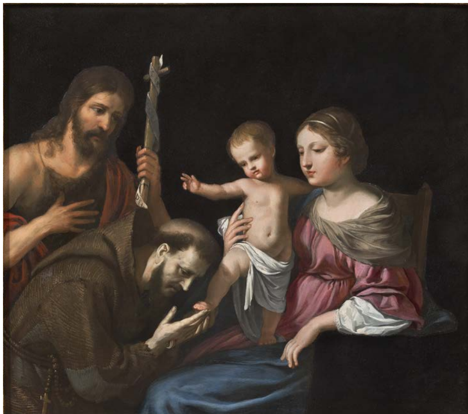
Jacques STELLA (Lyon, 1596 - Paris, 1657) La Vierge à l'Enfant avec Saint François et Saint Jean-Baptiste , vers 1635 Huile sur marbre, 38,2 x 42,6 cm

Provenance : Vente Joseph Artaud, Paris, 15 novembre 1791, lot numéro 90 ; Sotheby's, New York, 28 janvier 1999, lot 403 ; Collection particulière de la côte est des Etats-Unis.