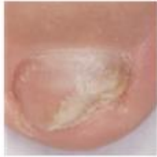
Prima del trattamento

E' importante proseguire il trattamento con lo smalto medicato fino alla completa risoluzione dell'infezione e alla completa rigenerazione dell'unghia. In genere occorrono circa 6 mesi di terapia per le unghie delle mani e da 9 a 12 mesi per le unghie dei piedi. Lei vedrà l'unghia sana ricrescere con il ridursi dell'unghia malata.