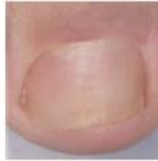
Dopo il trattamento

Se non osserva miglioramenti dopo 3 mesi deve consultare il medico.