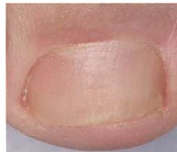
Dopo il trattamento

Se non osserva miglioramenti dopo 3 mesi deve consultare il medico.