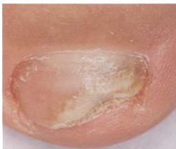
Prima del trattamento

È importante proseguire il trattamento con lo smalto medicato fino alla completa risoluzione dell'infezione e alla completa rigenerazione dell'unghia. In genere occorrono circa 6 mesi di terapia per le unghie delle mani e da 9 a 12 mesi per le unghie dei piedi. Lei vedrà l'unghia sana ricrescere con il ridursi dell'unghia malata.