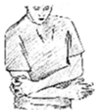
Fig. 1 Lavare e asciugare accuratamente la zona dolorante.

TRANSACT Lat è da impiegarsi esclusivamente per uso locale seguendo scrupolosamente le seguenti modalità d'uso.