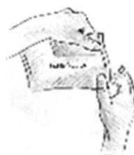
Fig. 2 Togliere un cerotto medicato dalla busta e richiuderla accuratamente.