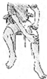
Fig. 5 Se la parte implicata è un'articolazione, prima dell'applicazione piegare leggermente l'articolazione stessa.

pellicola protettiva e applicare il lato adesivo direttamente sulla pelle.