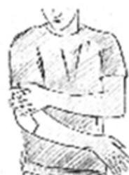
Fig. 4 Applicare il cerotto medicato sulla parte dolorante strisciandolo leggermente al fine di evitare la formazione di pieghe. Subito dopo l'applicazione può comparire una sensazione di freddo.