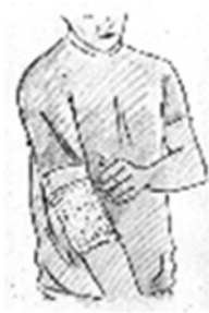
Fig. 6 Nel caso in cui TRANSACT Lat debba essere applicato su articolazioni molto mobili, come ad esempio il gomito od il ginocchio, è consigliabile l'uso del bendaggio di ritenzione accluso.

Applicare un solo cerotto medicato per volta sulla parte interessata ogni 12 ore.