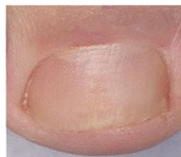
Dopo il trattamento

Se non osserva miglioramenti dopo 3 mesi deve consultare il medico.