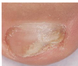
Prima del trattamento

È importante proseguire il trattamento con lo smalto medicato fino alla completa risoluzione dell'infezione e alla completa rigenerazione dell'unghia. In genere occorrono circa 6 mesi di terapia per le unghie delle mani e da 9 a 12 mesi per le unghie dei piedi. Lei vedrà l'unghia sana ricrescere con il ridursi dell'unghia malata.