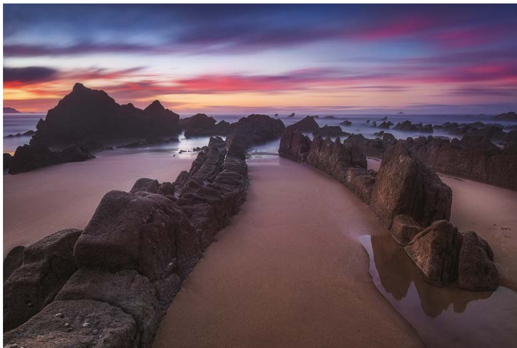
La Playa de Barrika, en Vizcaya, es muy frecuentada por surfistas

— PLAYA DE ITZURUN (ZUMAIA). Situada a los pies de la Ermita de San Telmo, patrón de los navegantes, es una espectacular playa, de 270 m de longitud, con arena dorada y unas peculiares paredes cortantes de piedra caliza, que en algunos puntos llegan hasta los 150 m de altura, creadas por un fenómeno geológico conocido como flysch, que dotan al lugar de una belleza inigualable. La marea que empuja el oleaje es muy fuerte. Es ideal para practicar surf o bodyboard. Fue uno de los escenarios de la serie Juego de Tronos.