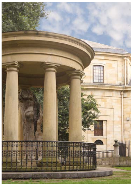
El árbol de Gernika, de una gran carga histórica para el País Vasco.

En una escala inferior, también destacamos la Playa de Talape, de arena fina y dorada, con un fuerte oleaje, que se sitúa en la desembocadura del río Oka; y la Playa de Arribolas, al lado del puerto viejo, compuesta principalmente por bolos, es un rincón idílico con una longitud de unos 260 m y una anchura constante de 25 m, perfecta para quienes buscan un espacio tranquilo.