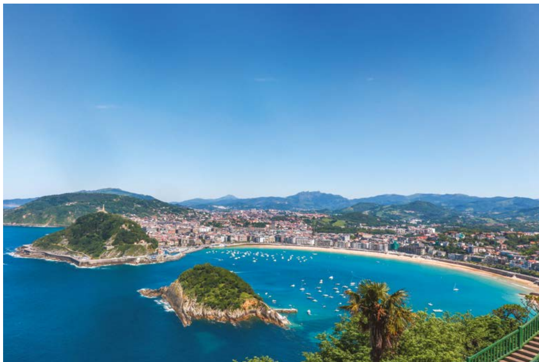
La playa de la Concha, en San Sebastián, está catalogada como una de las playas urbanas más bellas de toda España.