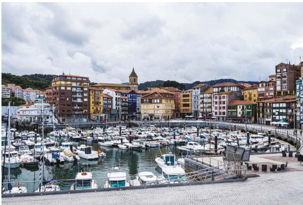
Bermeo, una bonita villa marinera de Vizcaya.

UNA LOCALIDAD DE LA COMUNIDAD VASCA CON ENCANTO