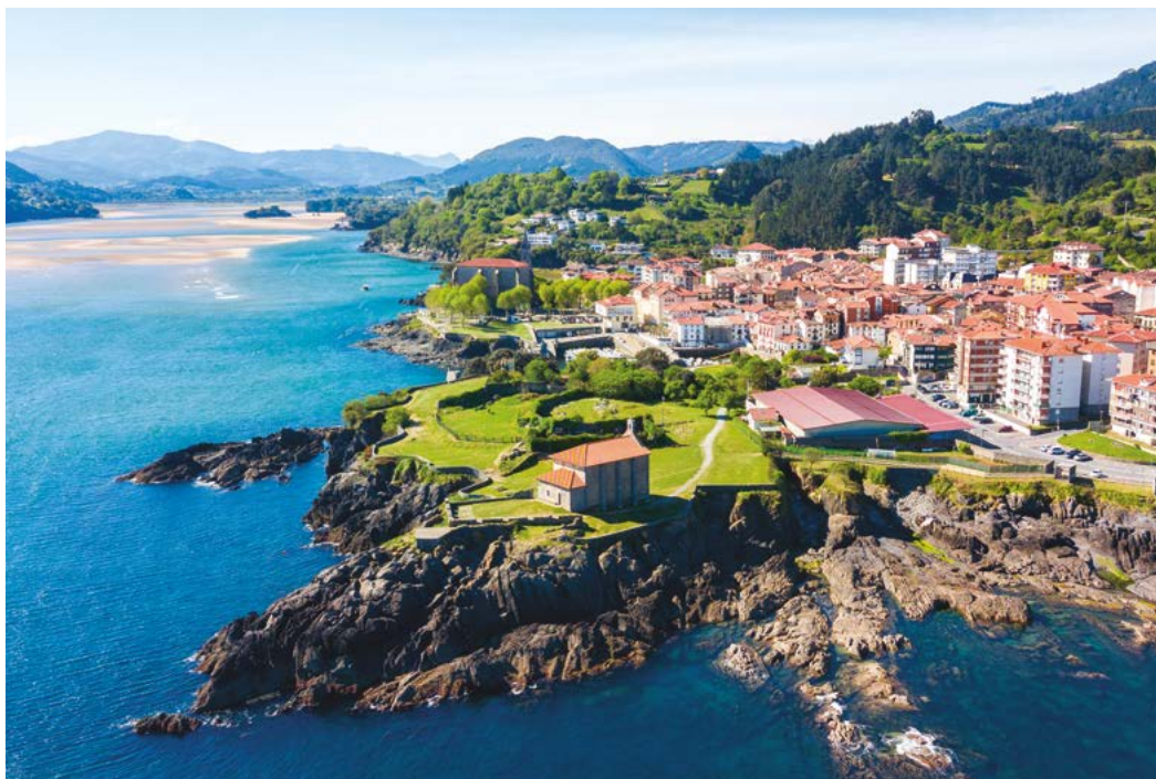
Vista aérea de la localidad vizcaína de Mundaka.

— ERMITA DE SAN PELAYO. Se localiza en la carretera que, bordeando la costa, une las poblaciones de Bakio con Bermeo. Se trata de un pequeño templo del s. XII, construido con estilo románico, compuesto por una sola nave, que mantiene completa e intacta su planta original, a pesar del paso del tiempo y de las distintas intervenciones.