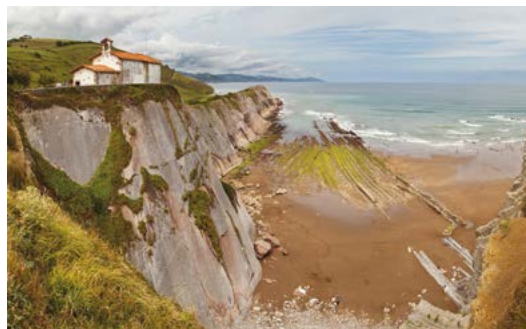
Los famosos flysch de Zumaya se sitúan en la Playa de Itzurun.