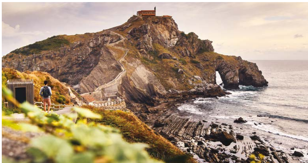
En San Juan Gaztelugatxe se rodaron escenas de la serie Juego de Tronos.

— IGLESIA DE SANTA EUFEMIA. Edificada también en el casco histórico, es la más antigua de la villa, ya que data del s. XIII, aunque fue reconstruida a finales del XV. Es un templo de estilo gótico, tal como lo demuestran las ventanas y puertas de la bóveda.