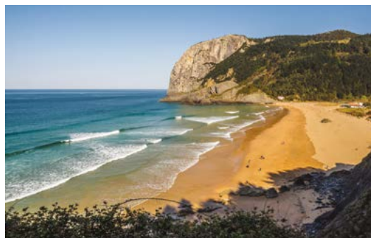
La playa vizcaína de Laga destaca por su gran belleza natural.

— PLAYA DE LA ANTILLA (ORIO). Playa semiurbana de 220 m de longitud, situada en un entorno excepcional, al este de la desembocadura del río Oria y protegida por el monte Kukuarri, que desciende de forma abrupta hacia el mar, formando un hermoso conjunto entre el mar, el río y la montaña. Está equipada con todo tipo de servicios y es un lugar muy frecuentado por aficionados a los deportes acuáticos como el surf, el piragüismo o el windsurf.