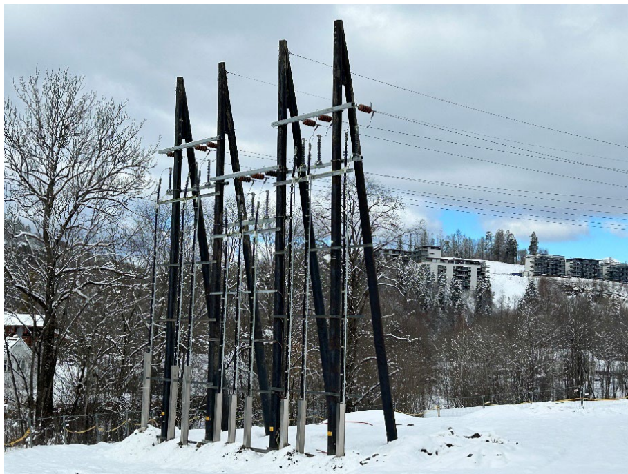
Fig.4, Mast nr. 244115, Provisorisk endemast.