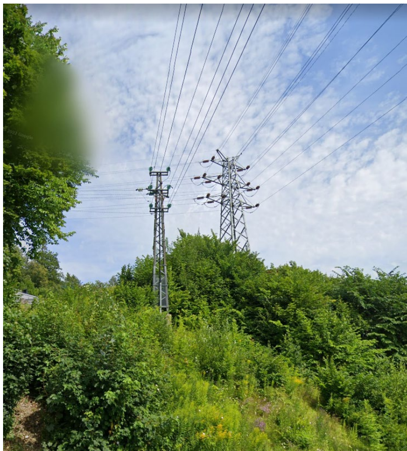
Fig 1. 22 kV og 47 kV master

Terreng skal tilbakeføres i henhold til NVE's veileder nr. 2/2021, «Veileder for terrengbehandling ved bygging av vassdrags- og energianlegg»