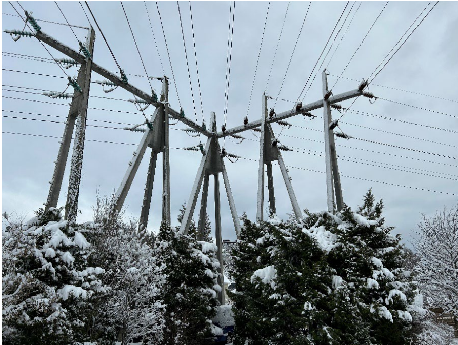
Fig2. Mast 244090, Betongmast

Mast 244090 er betong mast med 6 kurser plassert i knapp vinkel. Her skal den NØ-del av konstruksjonen bestå etter rivning, denne linjen skal rives på senere tidspunkt.