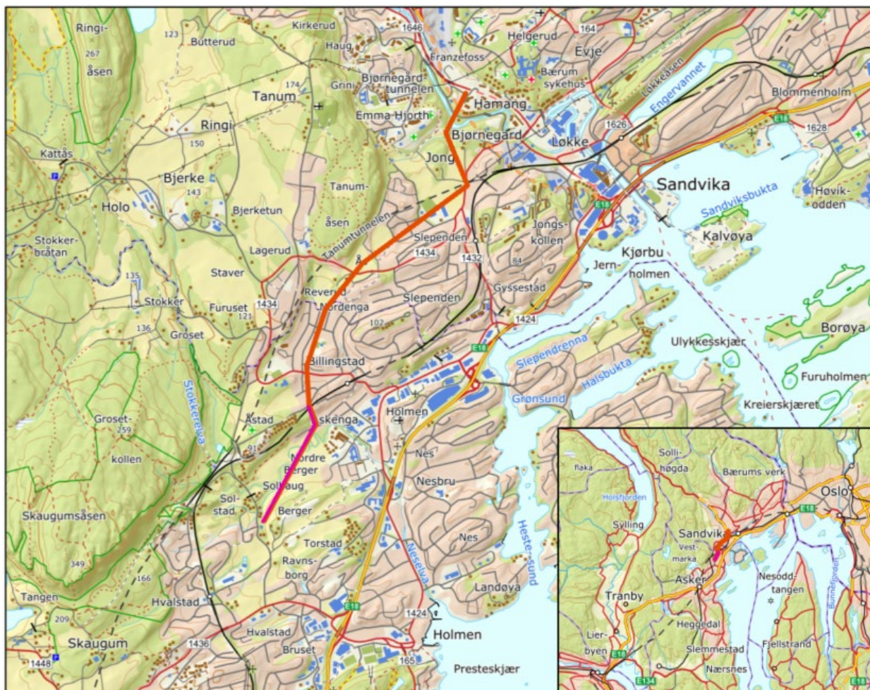
Fig. 1. Oversikt over tiltaket. Det vises også til detaljkartbeskrivet i kap. 7..

Fra Berger transformatorstasjon og frem til Åstadveien går en dobbeltkurs 22 kV-ledning som skal rives samtidig som riving av 47 kV-ledningen. Denne ledningen er underlagt områdekonsesjon og det er ikke direkte krav om utarbeidelse av Detaljplan, men siden rivingen skal utføres samtidig med riving av 47 kV ledningen, er det naturlig at utførelsen etterkommer samme krav.