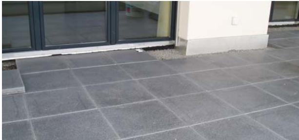
Bild 5: Verlegung über einer starren Betonkonstruktion mit einer Bettung

Ansesichts der niedrigen Wasseraufnahme von <0.1\% , auf Grund der das Wasser nur auf der Oberfläche abrinnen kann, kann trotz Berücksichtigung eines minimalen Oberflächengefälles auf Grund der Oberflächenspannung eine gewisse Wassermenge in den Ecken verbleiben, die nach kurzer Zeit verdampft oder mechanisch entfernt werden kann.