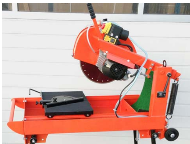
Bild 10: Steintrennmaschine mit geschlossener Diamant-Trennscheibe

Feinsteinzeug lässt sich aufgrund seiner extremen Härte nur sehr schwierig schneiden und es wird in jedem Fall das richtige Werkzeug benötigt. Als Fliesenschneider von Feinsteinzeugplatten sollte grundsätzlich eine Steintrennmaschine mit geschlossener Diamanttrennscheibe verwendet werden. Da Feinsteinzeug eine Härte von 9, Diamant allerdings eine Härte von 10 besitzt und damit das bis heute härteste Material ist, kann eine Diamant-Trennscheibe Feinsteinzeug gerade und sauber schneiden.