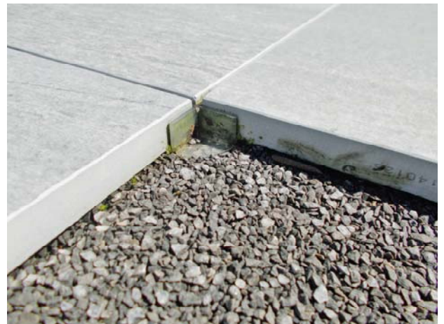
Bild 8: Verlegen der Feinsteinzeug Gehwegplatten in Bettungsschicht

Feinsteinzeug Gehwegplatten dürfen nicht stumpf gestossen werden, für die Fugen sind Abstandhalter zu verwenden. Passende Abstandhalter sind bei der CREABETON BAUSTOFF AG erhältlich.