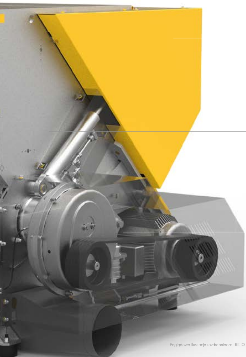
Poglądowa ilustracja rozdrabniacza LRK1000