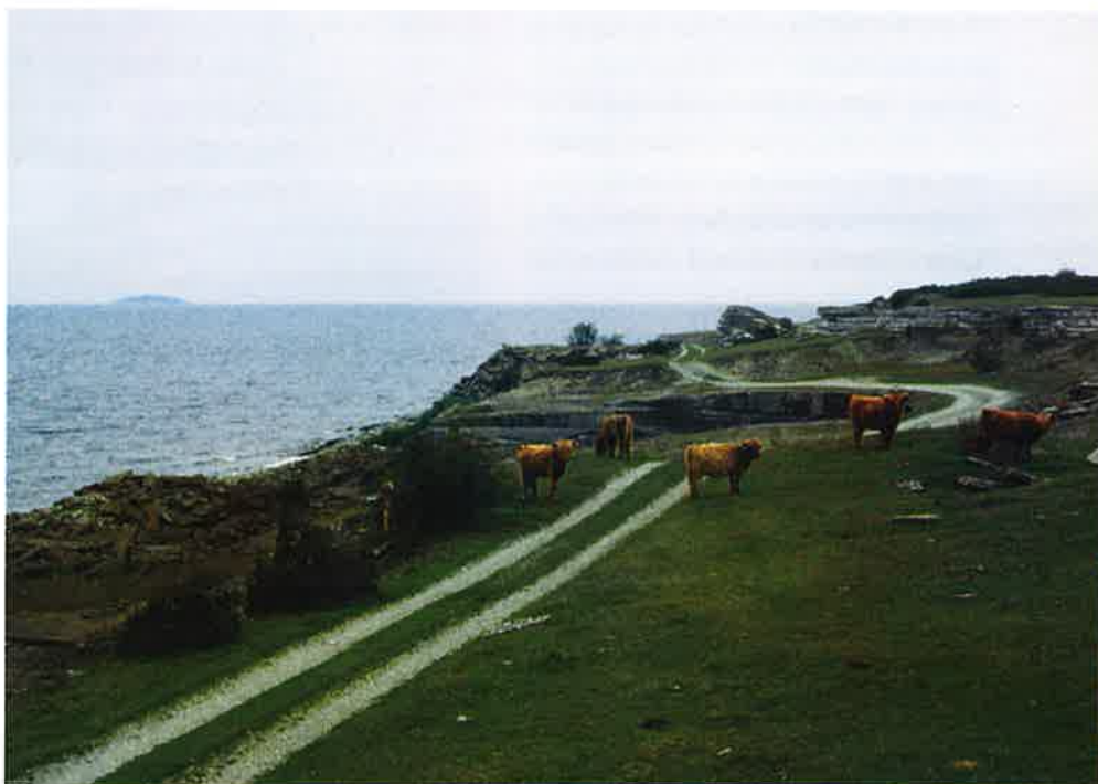
Betande highland cattle längs västra kustvägen.

Vägen går längs den öländska Stenkusten på västra landborgen och återfinns bland annat på kartor från 1600-talet. Hela kustvägen karakteriseras av spår efter en omfattande kalkstensbrytning och vägen har därför varit av stor betydelse för transporter till utskepningshamnar. Utmed vägen finns också välbevarad sjöbodbebyggelse. Naturen präglas av klintkusten och det öppna beteslandskapet. Särskilt vid Jordhamn finns ett mycket särpräglat landskap med terrassartade betesmarker och enbuskar. Här växer bland annat fältsippa och klöverärt. Vid Jordhamn finns Ölands enda bevarade skurkvarn. Dessa vinddrivna skurkvarnar användes i början av seklet för att slipa den öländska kalkstenen. Vid vägen finns även flera gravfält och stensträngssystem från järnåldern. Söder om Horns udde finns bland annat ett 1,5 kilometer långt stråk med rösen väster om vägen. Sevärda platser utmed vägen är Äleklinta, Bruddesta fiskeläge, Jordhamn, Gillberga och Horns udde m fl.