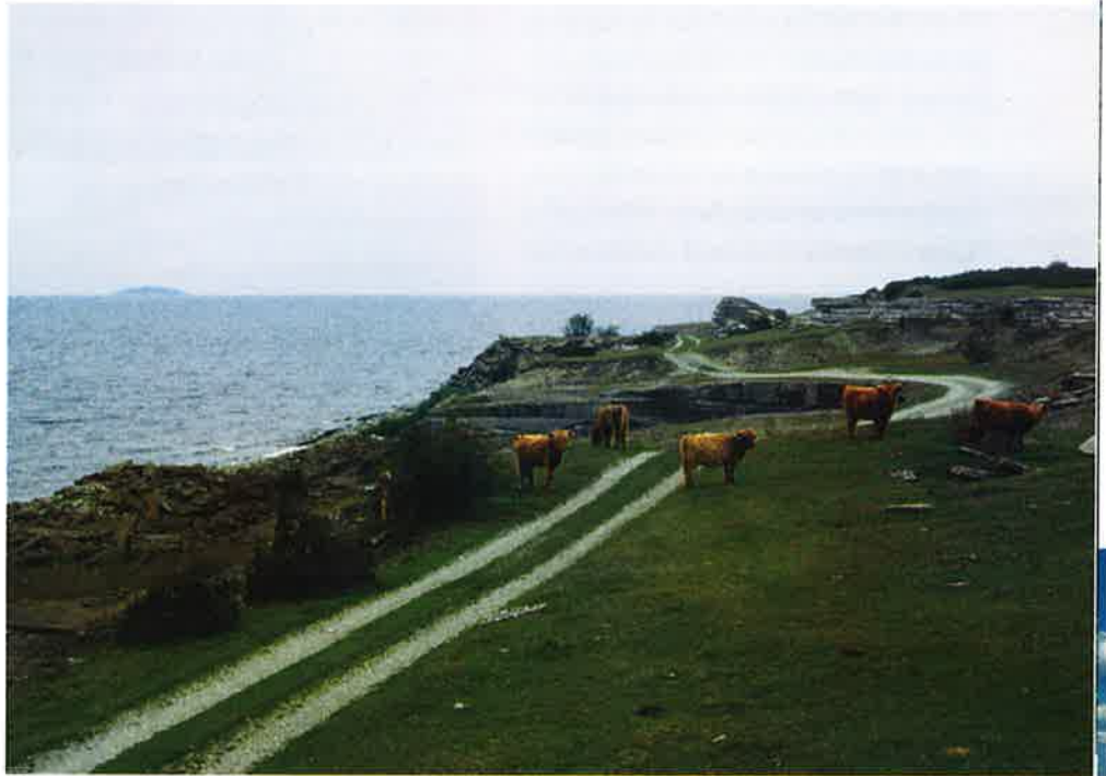
Betande highland cattle längs västra kustvägen.

Vägen går längs den öländska Stenkusten på västra landborgen och återfinns bland annat på kartor från 1600-talet. Hela kustvägen karakteriseras av spår efter en omfattande kalkstensbrytning och vägen har därför varit av stor betydelse för transporter till utskepningshamnar. Utmed vägen finns också välbevarad sjöbodbebyggelse. Naturen präglas av klintkusten och det öppna beteslandskapet. Särskilt vid Jordhamn finns ett mycket särpräglat landskap med terrassartade betesmarker och enbuskar. Här växer bland annat fältsippa och klöverärt. Vid Jordhamn finns Ölands enda bevarade skurkvarn. Dessa vinddrivna skurkvarnar användes i början av seklet för att slipa den öländska kalkstenen. Vid vägen finns även flera gravfält och stensträngssystem från järnåldern. Söder om Horns udde finns bland annat ett 1,5 kilometer långt stråk med rösen väster om vägen. Sevärda platser utmed vägen är Äleklinta, Bruddesta fiskeläge, Jordhamn, Gillberga och Horns udde m fl.