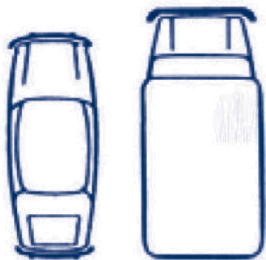
Grafico dell'incidente al momento dell'urto

Indicare i danni visibili al veicolo DRIVALIA