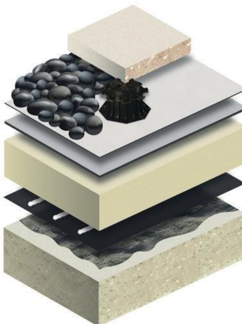
Sistema de Cubierta Caliente Lastrada