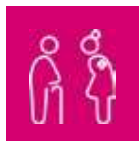
L'aide-soignant, l'aide-médico-psychologique et l'auxiliaire de vie

« Je réalise vos soins infirmiers qu'ils soient de traitement et de confort dans le respect de la prescription du médecin traitant. Je m'assure que les autres soins sont réalisés conformément à votre projet de soins. Je prends les rendez-vous pour les consultations.»