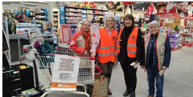
Collecte de produits au côté de la Banque Alimentaire de Savoie