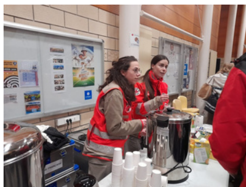
Eboulement sur la RN90