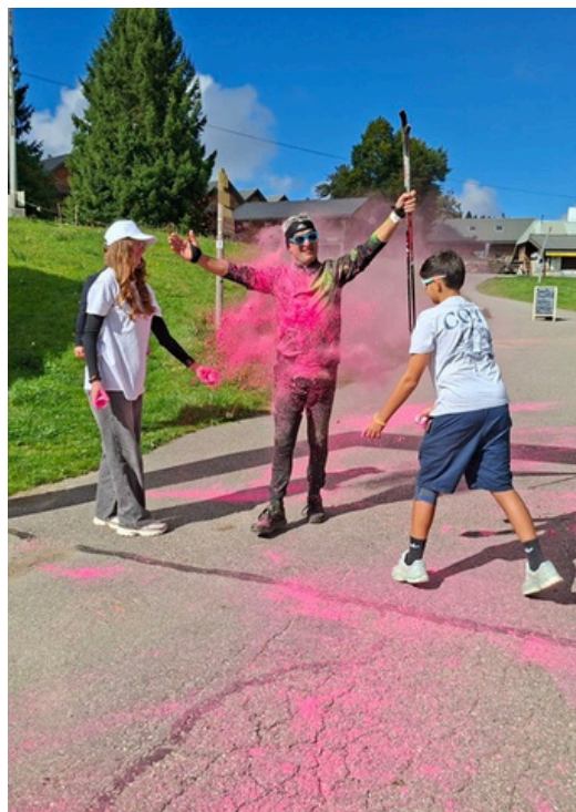
Course à pied "ColorRun"

Une dizaine de jeunes anime notre réseau au sein de notre département. Avec des actions comme