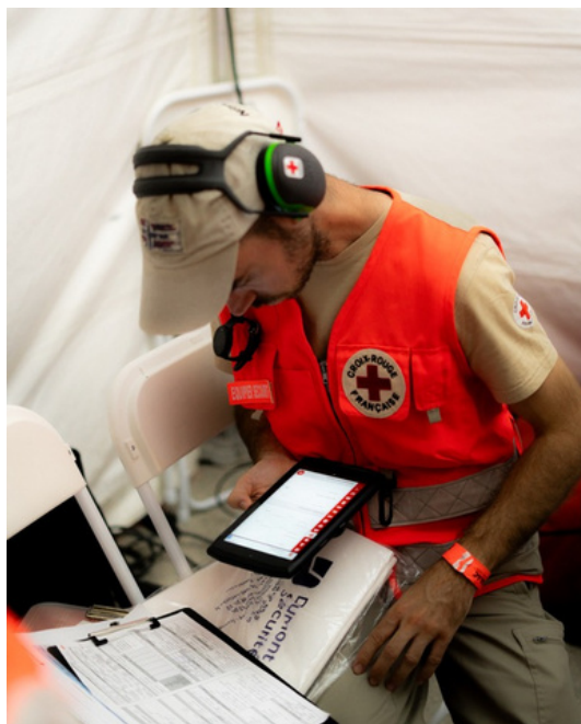
Bilan secouriste numérique