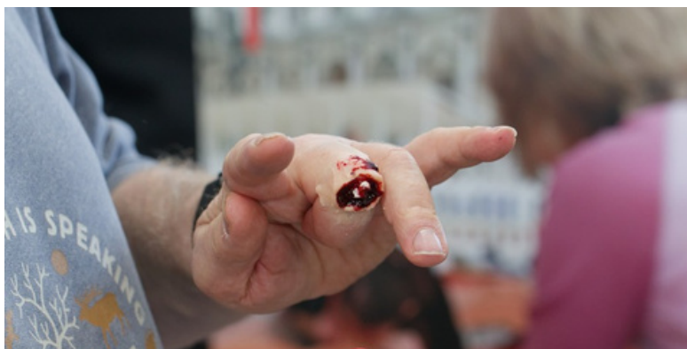
Formation maquillage pour les formateurs