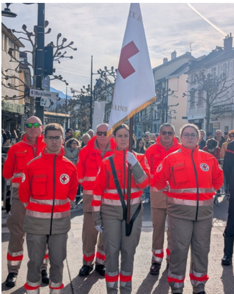
Devoir de mémoire : cérémonie du 11 novembre à Aix les bains