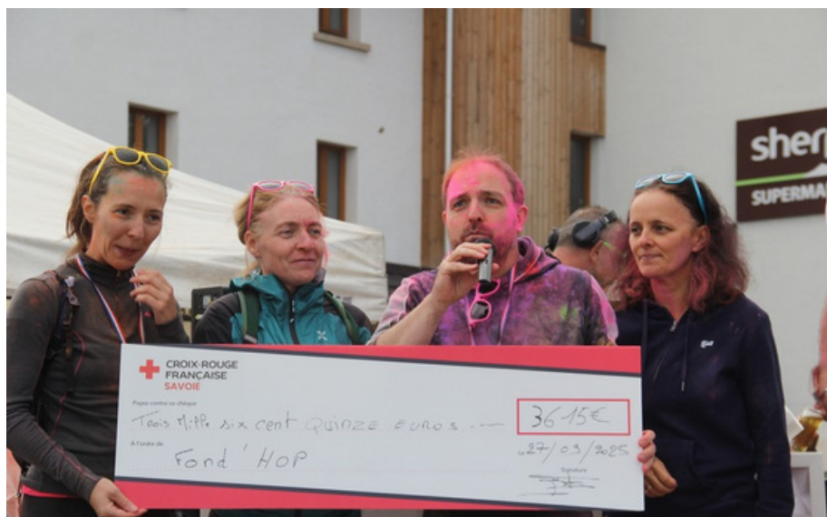
Remise des gains de la course au service de pédiatrie de Chambéry