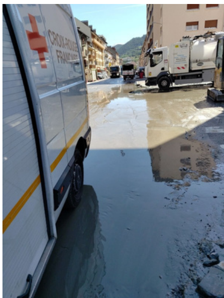
Coulée de boue à Fourneaux - Modane