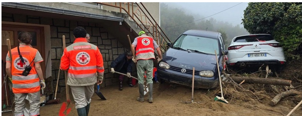
Opération Coup de Main - Coup de Coeur : aider les habitants nettoyer les habitations pour un retour le plus vite possible à la normale.