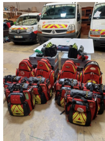
Préparation du matériel