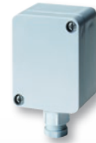
Fühler für Außenmontage Sensor for outdoor mounting