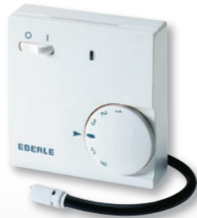
FR-E 525 31

Floor Heating Controller – with remote sensor