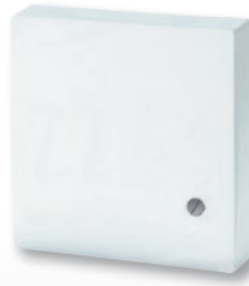
F 190 021