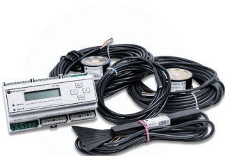
PST 5000 -järjestelmä antureineen

Ulkoanturi voidaan sijoittaa jopa 100 metrin etäisyydelle termostaatista. Termostaatti sisältää ulkoanturin. Sulanapidon ohjausjärjestelmä PST 5000 kytkee lämmityksen päälle ainoastaan silloin, kun on todellinen sulatuksen tarve, ts. pintoihin voi muodostua jäätä. Laite kytkee myös lämmityksen pois, kun lämmitettävä pinta on kuivunut.