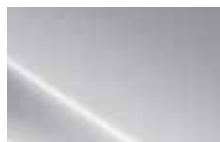
Platinum Silver (T8S) Metallic