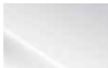
Polar White (WAW) Solid