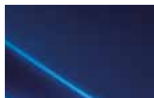
Marina Blue (N4B) Metallic