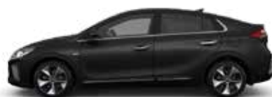
Phantom Black (NKA) Pearl Metallic