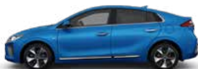
Marina Blue (N4B) Metallic