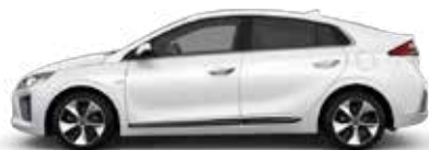
Polar White (WAW) Solid