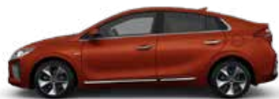
Phoenix Orange (RY9) Pearl Metallic