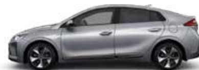
Aurora Silver (TS7) Pearl Metallic