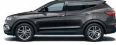
PHANTOM BLACK (Pearl) NKA