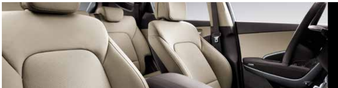
BEIGE LÄDERKLÄDSEL TILLVAL TILL PREMIUMPLUS. FABRIKSBESTÄLLNING.