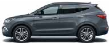
OCEAN VIEW (Metallic) W8U