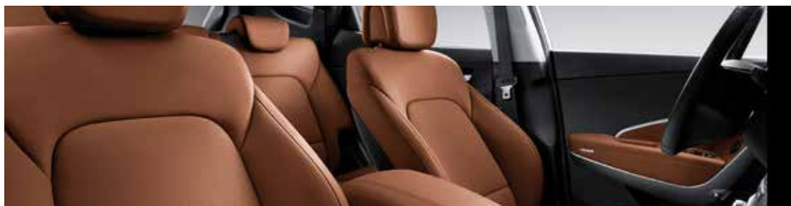
BRUN LÄDERKLÄDSEL TILLVAL PREMIUMPLUS TILL EXTERIÖR FÄRG PHANTOM, BLACK (NKA) OCH TITANIUM SILVER (T6S)