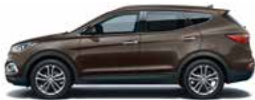
TAN BROWN (Pearl) YN7