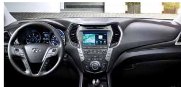
BRUN LÄDERKLÄDSEL + SVART INSTRUMENTPANEL