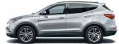
SLEEK SILVER (Metallic) N3S