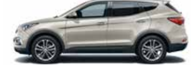
CHALK BEIGE (Metallic) VY2