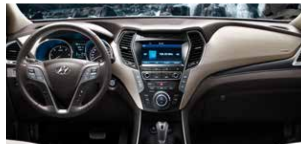
BEIGE LÄDERKLÄDSEL + MÖRKBRUN/BEIGE INSTRUMENTPANEL