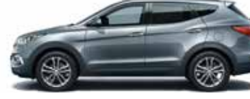
TITANIUM SILVER (Metallic) T6S