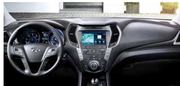
SVART LÄDERKLÄDSEL + SVART INSTRUMENTPANEL