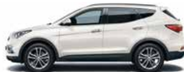
CREAMY WHITE (Solid) NCW