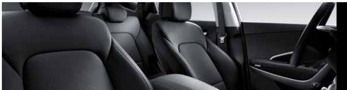
SVART LÄDERKLÄDSEL TILL ALLA EXTERIÖRFÄRGER