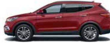
RED MERLOT (Pearl) VR6