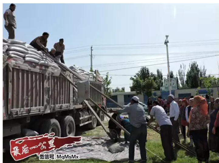
“喂，朋友，你站远些，我劲大得很！”康菊协调相关单位，免费提供100吨“爱心水泥”，帮助阿合雅镇塔尔其村和乌什镇英买里社区183户贫困群众解决庭院受损的困难。（乌什县委宣传部外宣办 李彩霞）