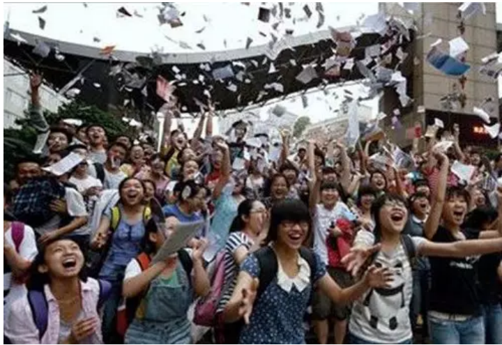
考试结束后，复习资料都会“飞”了

6、学习一个新技能。不管你是考驾照、学厨艺或是其他什么，总之你得在开学前，再会点什么。