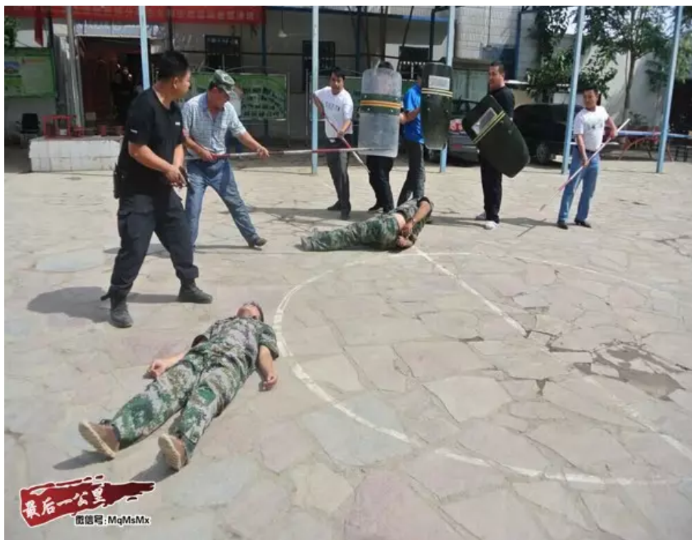
应急演练,防患于未然。鲁克沁镇迪汗苏村党支部会同住村工作组、警务室、民兵连共计18人开展了应急处突演练。（鄯善县纪检委住鲁克沁镇迪汗苏村工作组 马丽娟）