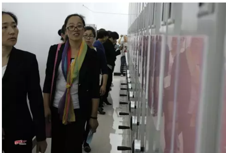
“国际档案日”这天，哈巴河县档案局举行了档案馆开放日活动。零距离感受档案文化的独特魅力。（@网友 朱广慧）