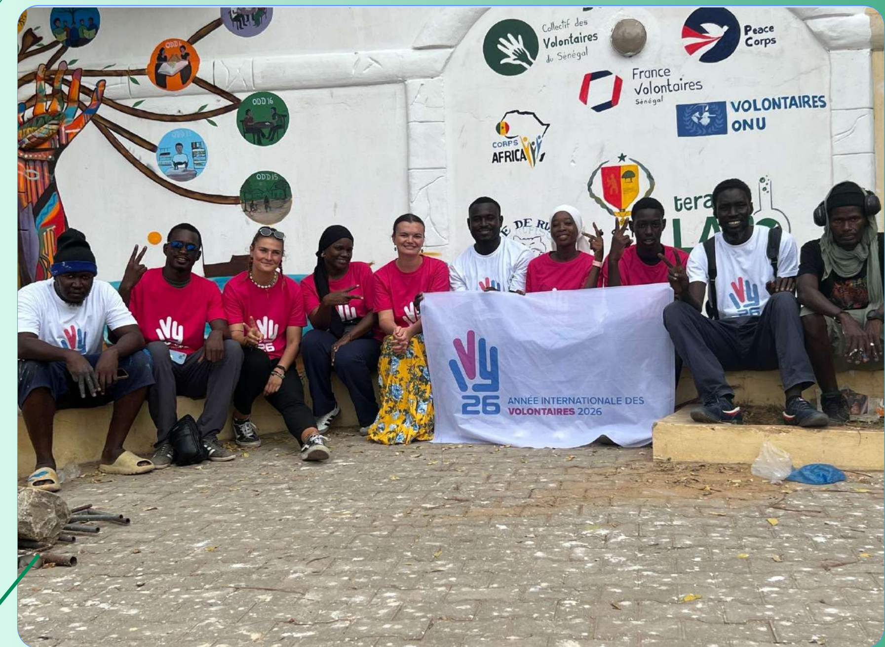
Inauguration de la fresque murale pour le lancement de l'année internationale pour le volontariat, Rufisque (2025)