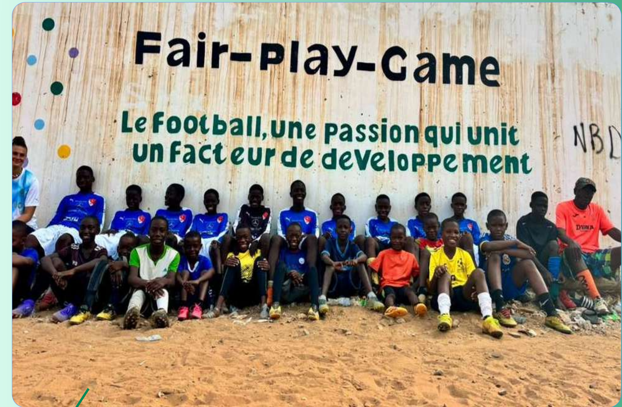
"Jaang ak Football" Ecole de football EUSEBIO, Sicap Liberté 5A (2025-2026)

Le CODEVS a progressivement mis en place des mécanismes de collaboration avec différentes organisations d'accueil et partenaires institutionnels. Cette structuration permet de définir les rôles des organisations, les conditions d'engagement des volontaires et les modalités de suivi des missions.