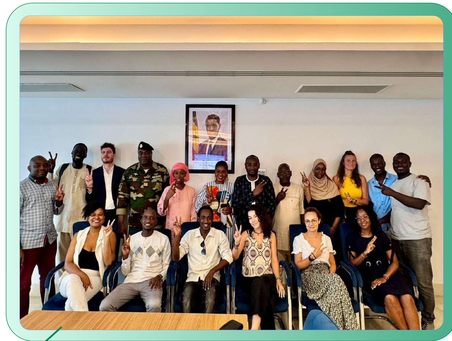
Partenariat avec la DGSCNV dans le cadre de la JIV internationale, Dakar (2025)

Enfin, la Direction de la Vie Associative et des Actions Sociales (Ministère de la Jeunesse) s'est liée au Collectif pour des activités de volontariat associatif, ainsi que de sa structuration et de sa normalisation.