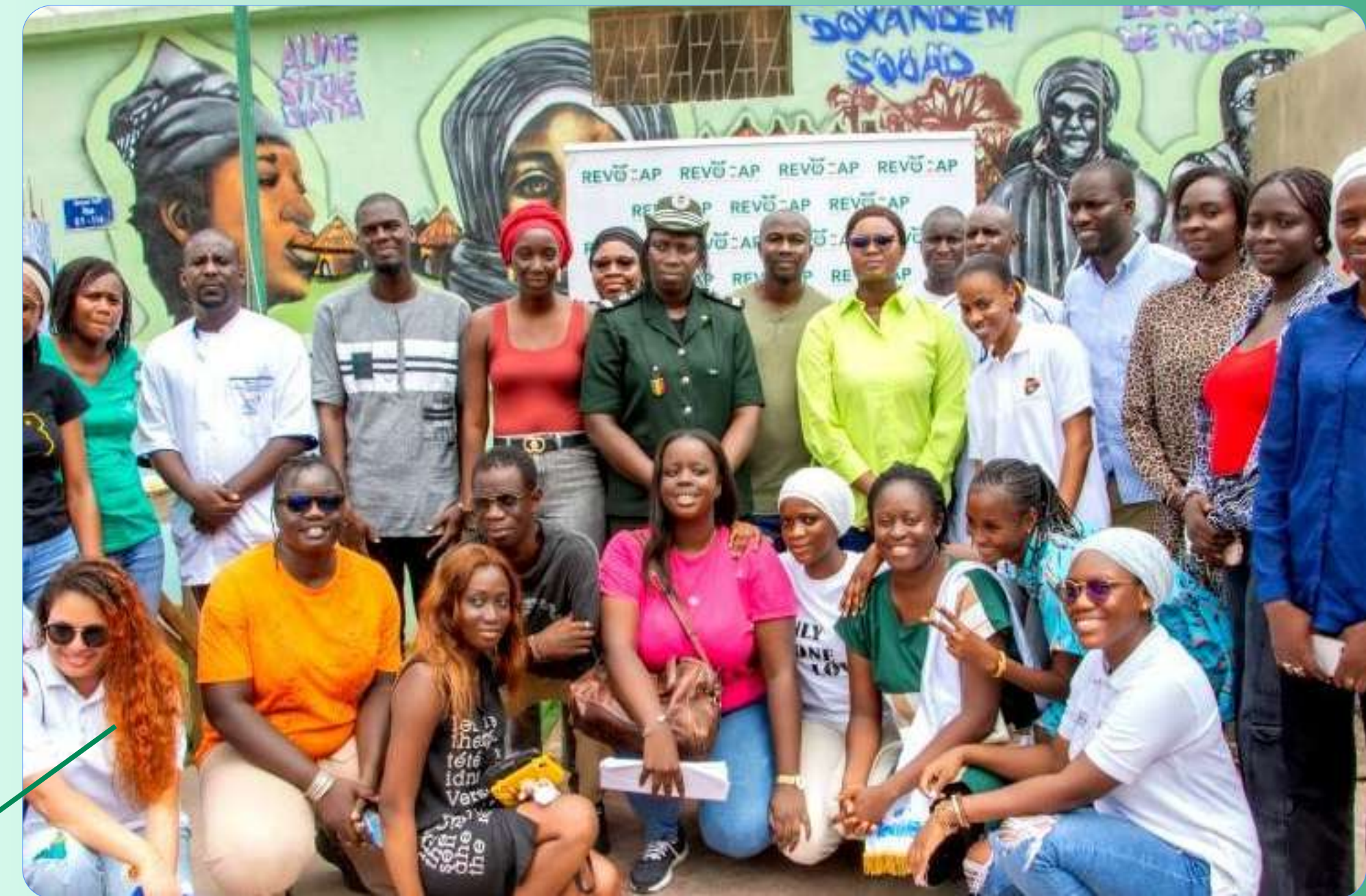
Journée de consultation psychiatrique et psycho-sociale, Dakar (2023)

Le CODEVS soutient les actions d'utilité publique portées par des organisations membres du Collectif et des volontaires, notamment dans les domaines de l'environnement, de la santé communautaire et de la solidarité locale.