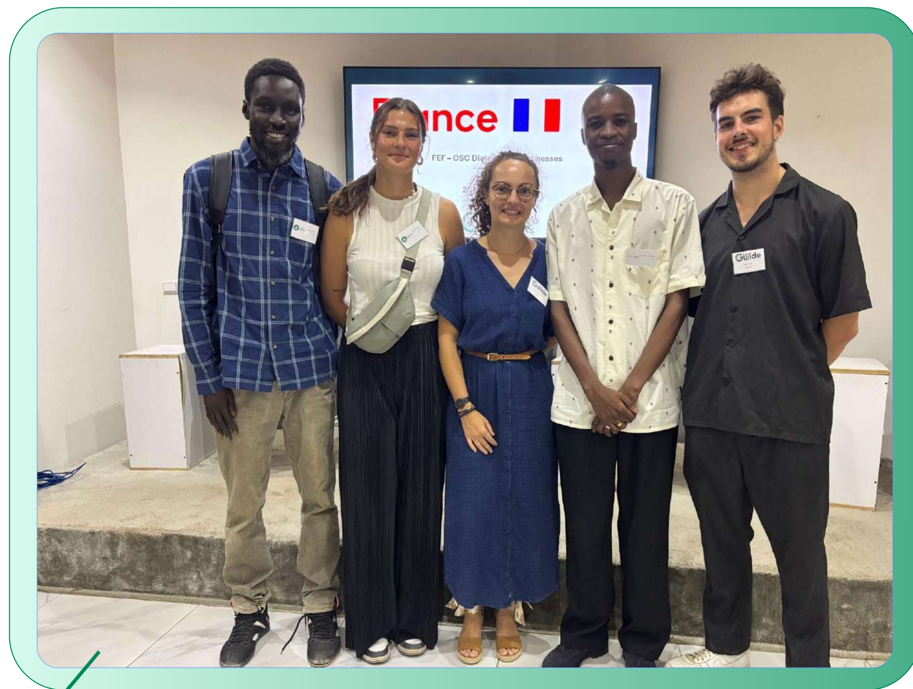
Dialogue des OSCs facilité par La Guilde, Dakar (2025)

Enfin, le Collectif est membre de International Association of Volunteering Efforts (IAVE) et de son réseau le Global Network of Volunteering Leaders Africa. Cette adhésion à ce réseau régional permet d'identifier les acteurs du volontariat en Afrique, d'échanger avec des spécialistes sur la vision africaine et de faire entendre la voix de l'Afrique sur le plan international concernant les questions liées à la promotion du volontariat.