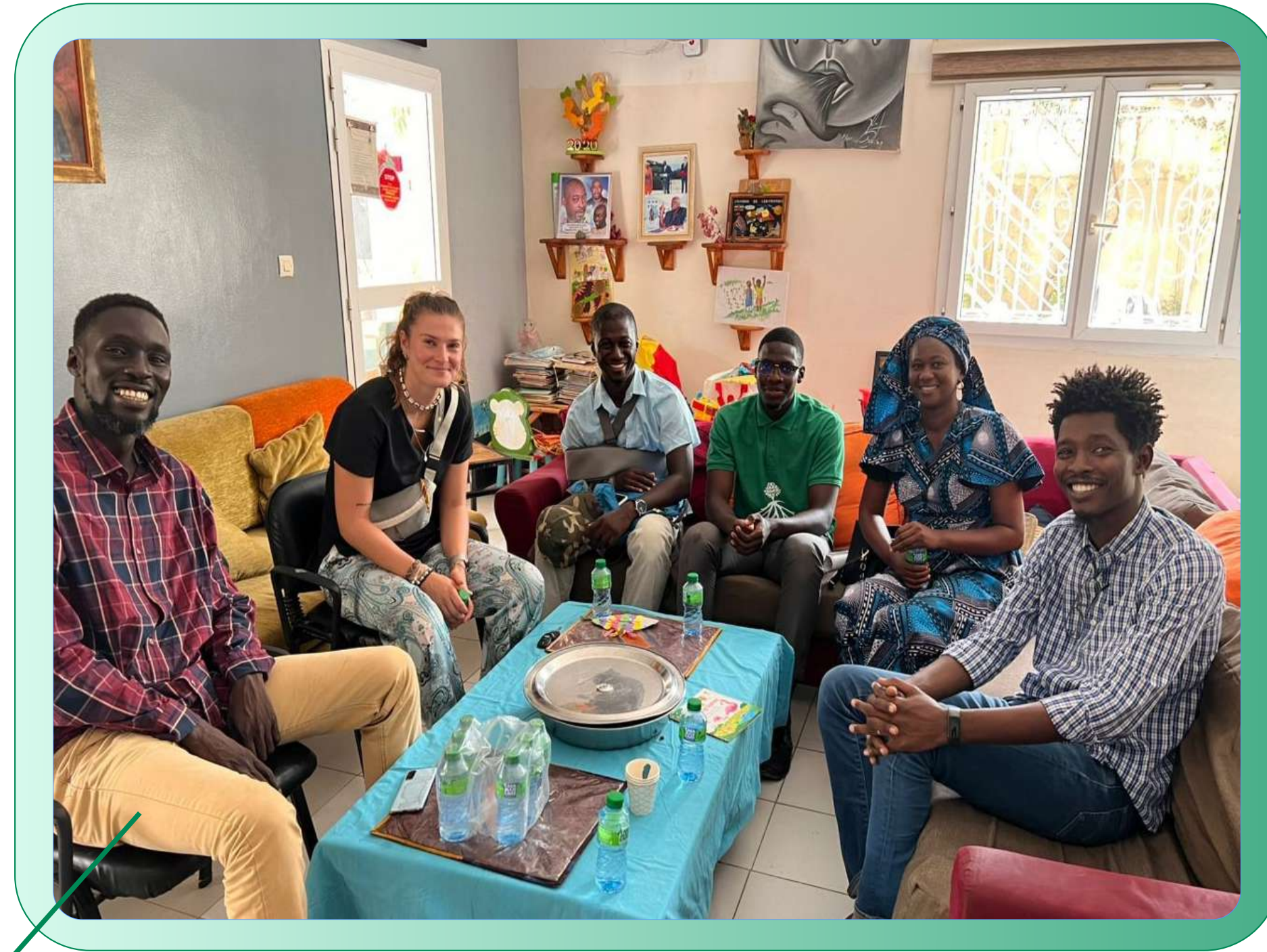
Déploiement d'une mission de volontariat à l'Empire des enfants, Dakar (2025)

L'ensemble des relations partenariales ont joué un rôle important dans l'écriture de l'identité singulière et authentique du CODEVS. La diversité et les différentes formes de partenariats expérimentées par le Collectif ont soutenu la durabilité de ses actions durant ses cinq dernières années.