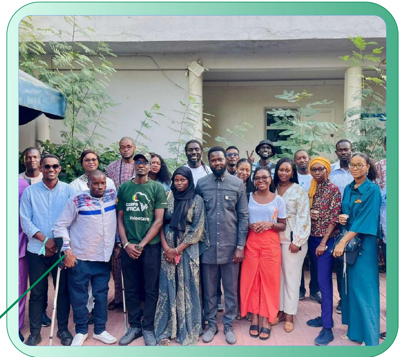
Comité ad hoc des acteurs du volontariat, Dakar (2023)

Le CODEVS a également participé à l'organisation de la JIV institutionnelle du Sénégal en 2023, organisée par l'Etat du Sénégal. A cette occasion, il a reçu une lettre de remerciement du Ministre de la Jeunesse de l'époque.