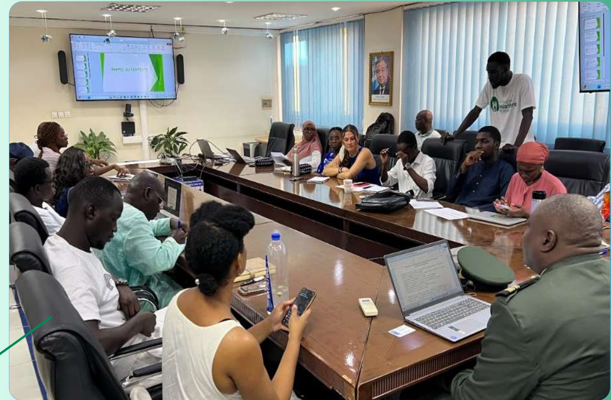
Atelier de préparation de la Journée Internationale du Volontariat, Dakar (2025)

A l'issue de ces temps d'échanges, le collectif a été mandaté comme point focal national technique par le Secrétariat international de la célébration de l'année internationale du volontariat (IVY 2026).