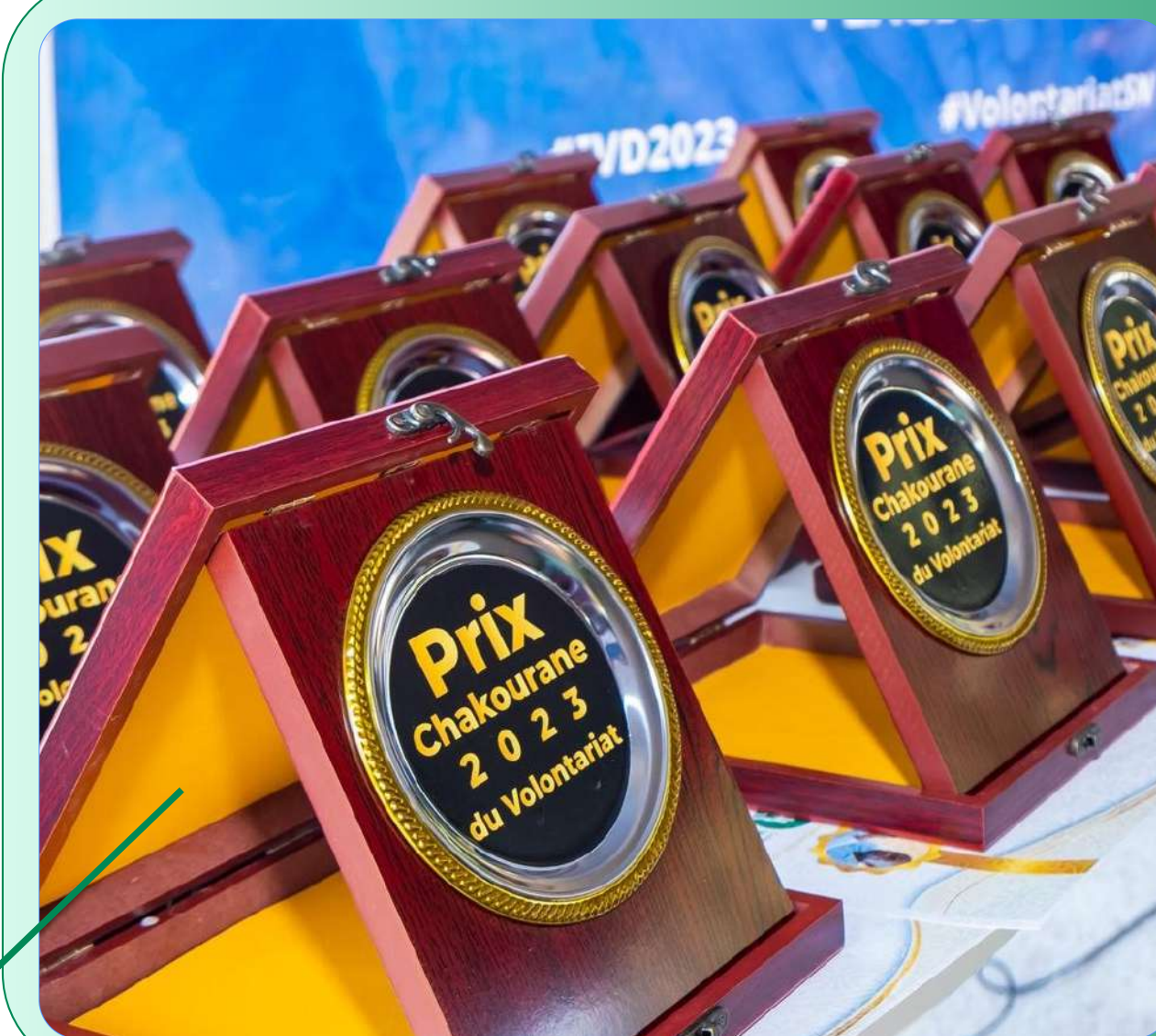
Remise des prix Chakourane, Popenguine (2023)