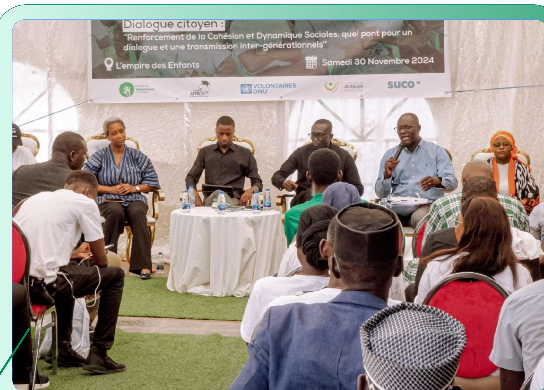
Week-end des Volontaires – Dialogue citoyen , Dakar (2024)