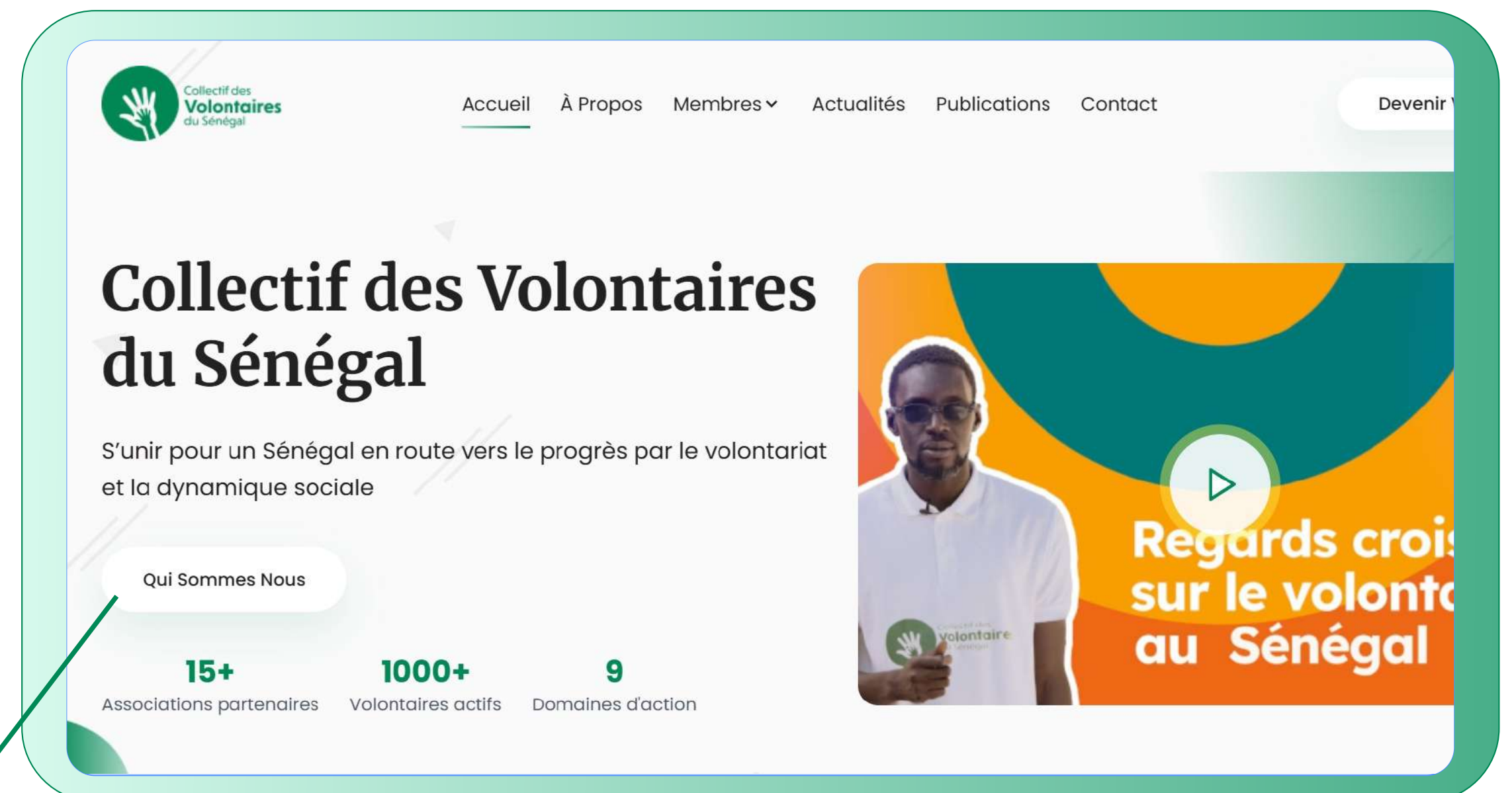
Plateforme web de promotion et d'évaluation du volontariat (2024)

Le centre de ressources numérique de la plateforme abrite toute documentation liée au volontariat au Sénégal. Cette plateforme a permis au CODEVS de recruter ses premiers volontaires de compétence sénégalais et Service Civique français.