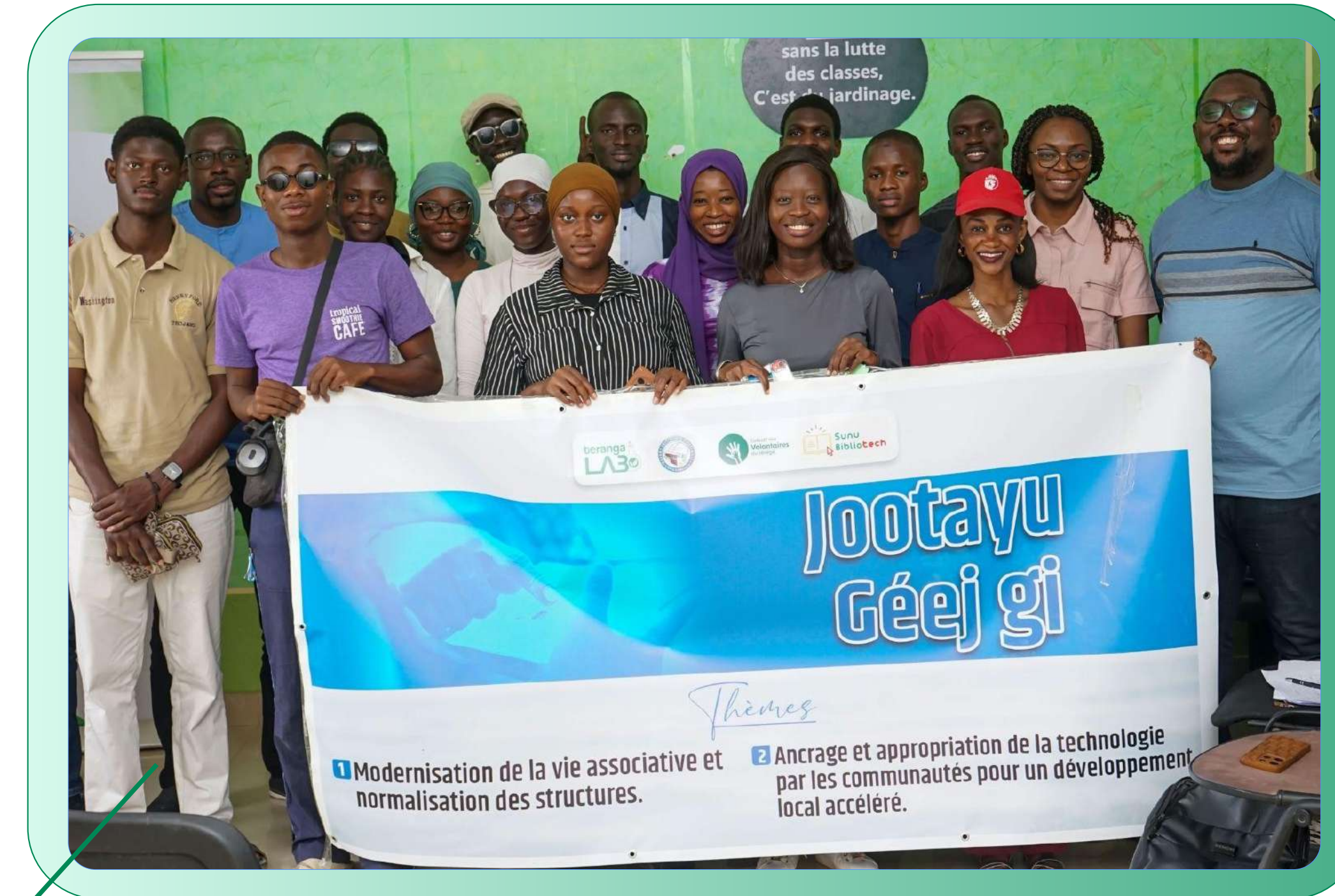
Atelier de modernisation de la vie associative, Rufisque (2025)

En 2025, six associations de Bargny et Rufisque ont bénéficié d'un appui-conseil dans le cadre du lancement du pilote "Jootayu Géej gi". Les trois partenaires d'implémentation de ce pilote sont Teranga Lab, Bargny Initiatives Citoyennes et la Médiathèque de Bargny.