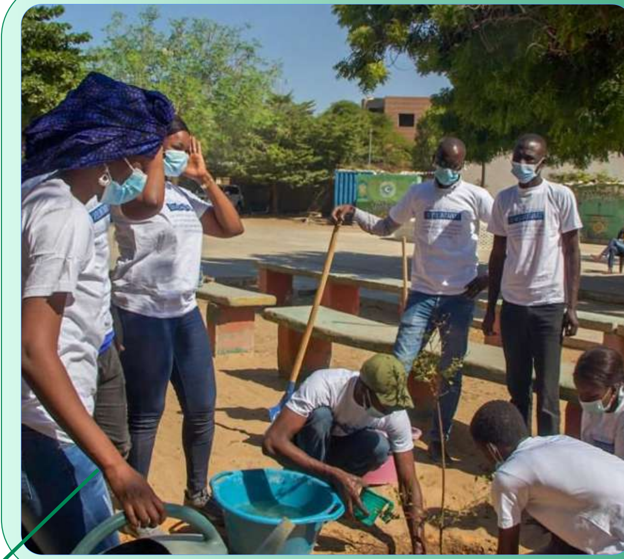
Fondation du Collectif, Dakar (2020)

Cette étape correspond à la création et l'organisation de la première JIV associative ayant permis de rassembler 40 volontaires et bénévoles ainsi que 6 à 8 associations membres du Collectif. L'activité avait été financée à 100% par les membres du Collectif.