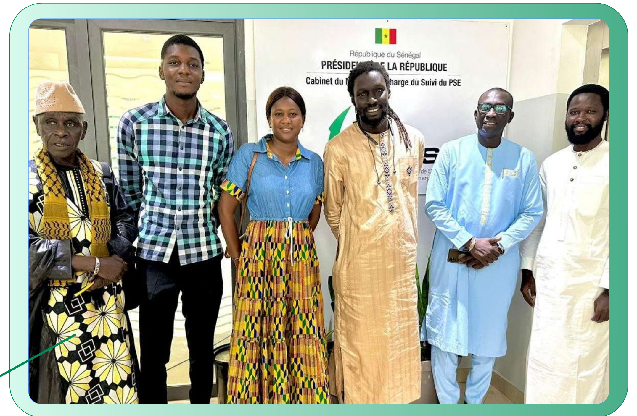
Réforme PSE-PJ, Dakar (2023)

Ces réformes représentent une avancée significative dans la promotion et la valorisation du volontariat au Sénégal. Elles constituent un pas important vers la construction d'une société plus solidaire, dynamique et engagée.