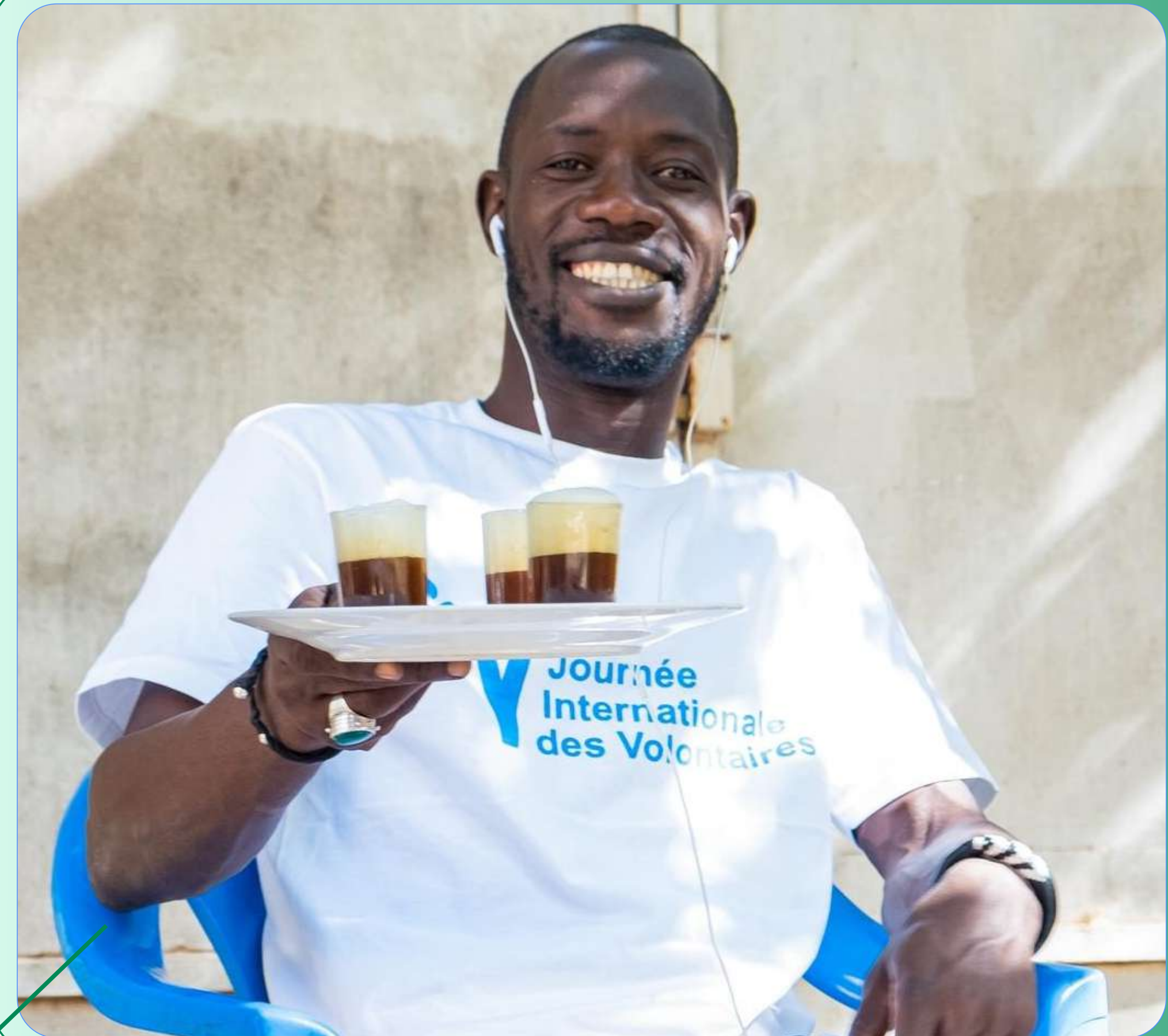
Célébration de la JIV, Popenguine (2023)

Durant cette même période, les activités d'appui-conseil occupent également une place importante. Elles traduisent un travail parallèle de structuration du secteur associatif et de contribution aux mécanismes institutionnels liés au volontariat. Autrement dit, la construction de la visibilité du collectif s'est accompagnée d'un travail plus discret mais essentiel de consolidation organisationnelle et de dialogue avec les institutions.