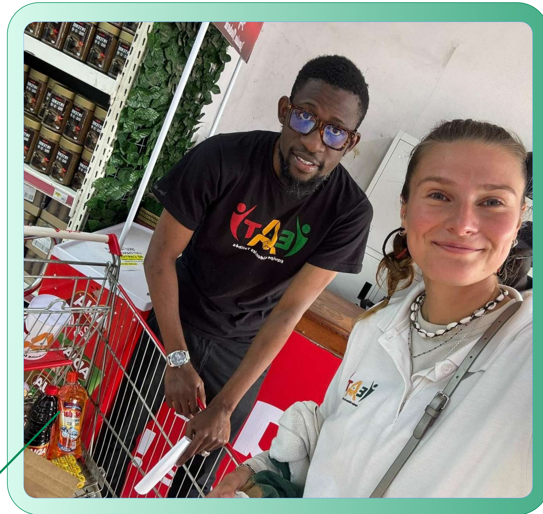
Collecte de denrées alimentaires pour l'activité “Korité pour Tous” avec EAT – Dakar (2026)

Toutes mes félicitations encore et à nous revoir pour d'autres missions encore plus belles.”