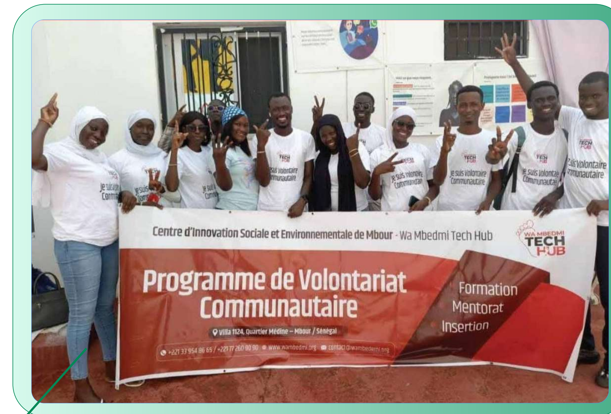
Programme de volontariat communautaire, Mbour - 2024

A l'issue de cette expérience, le Collectif a décidé de mettre en place un programme de volontariat de compétence en avril 2025 pour une durée de 9 mois. Ce programme permet le développement du capital humain et la professionnalisation des associations au Sénégal. A ce jour, 3 missions de volontariat de compétence ont déjà été effectuées.