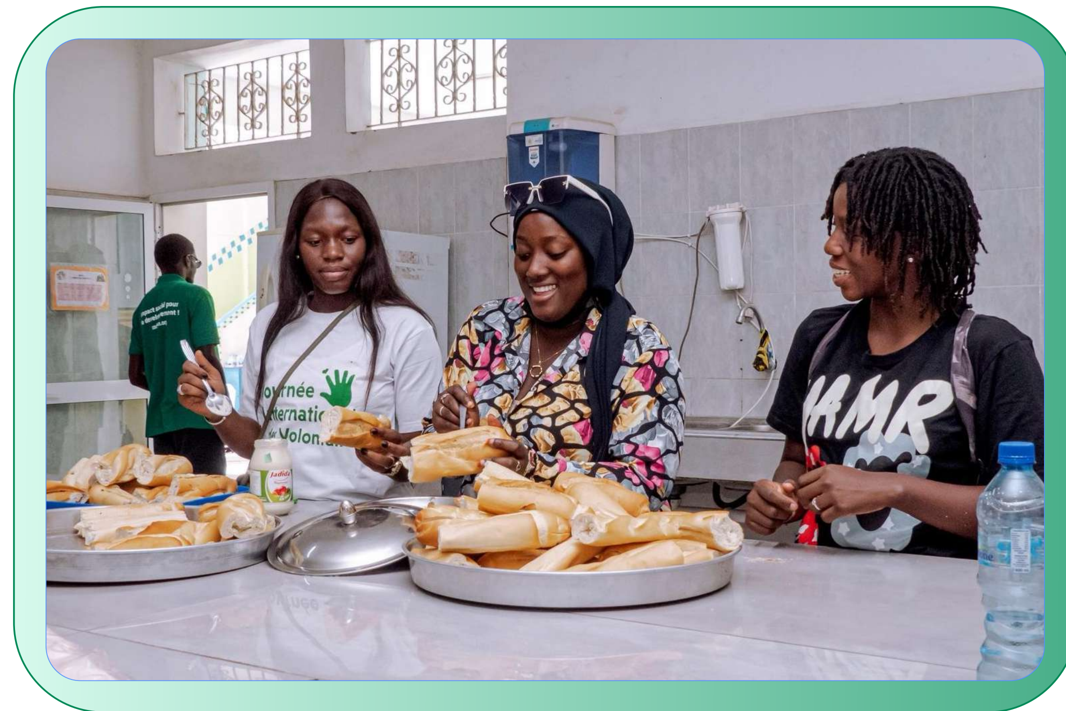
Célébration de la JIV, Dakar (2024)

Le CODEVS est né de ce constat. Le collectif s'est constitué pour contribuer à structurer cet écosystème en créant un espace de coordination, de dialogue et de coopération entre les acteurs du volontariat. Son objectif est de renforcer les organisations engagées dans l'action citoyenne, de valoriser l'engagement volontaire et de favoriser les synergies entre initiatives.