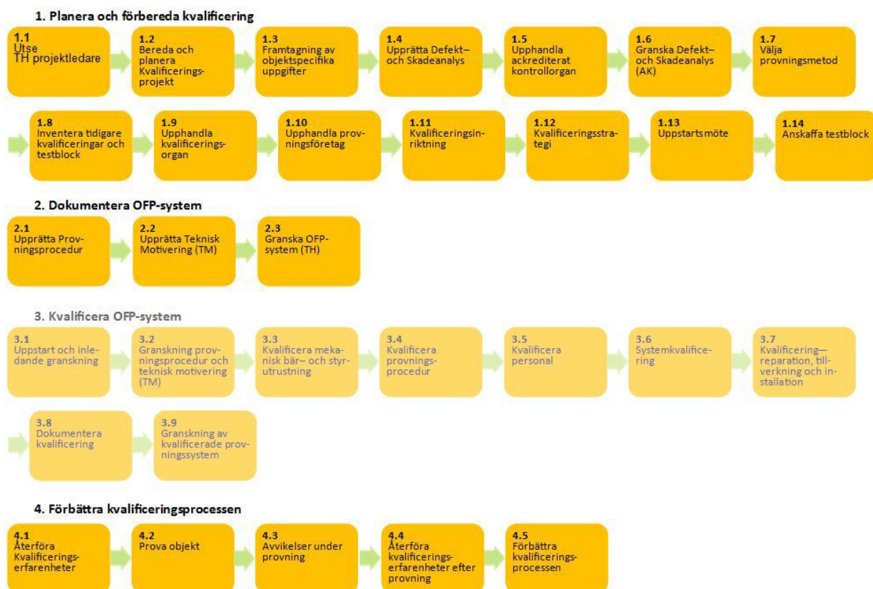
Figur 1 Översiktligt processschema

Avvikelser i processordningen bör vara i förväg överenskomna mellan inblandade parter