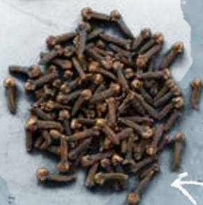
CLOVES LÆS MERE PÅ VORES HJEMMESIDE