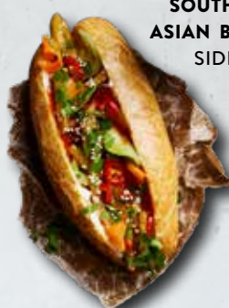
SOUTH EAST ASIAN BANH-MI SIDE 24