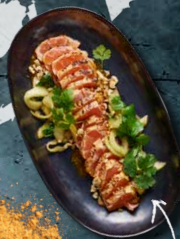
JAPANESE TATAKI SIDE 23