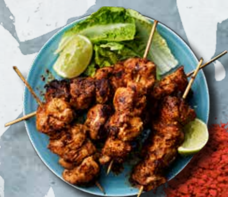
TANDOORI CHICKEN LÆS MERE PÅ VORES HJEMMESIDE