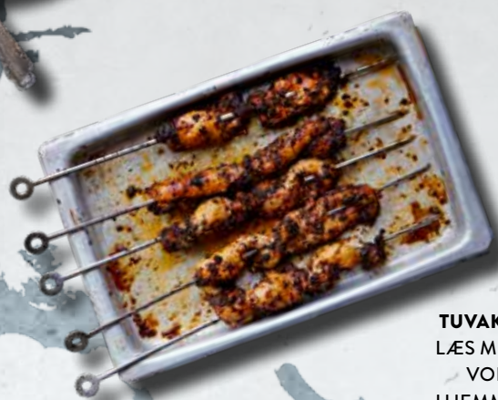
TUVAK SPITS LÆS MERE PÅ VORES HJEMMESIDE