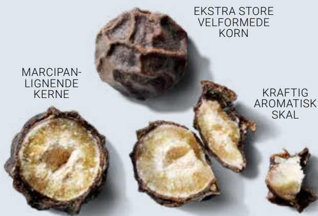
EKSTRA STORE VELFORMEDE KORN