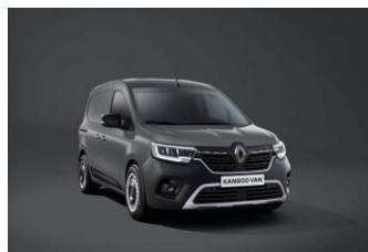
URBAN GRÅ (KPW)