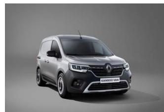
HIGHLAND GRÅ (KQA)