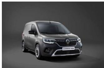
CASSIOPEE GRÅ [KNG]