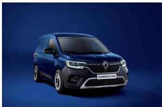
CANVASIT BLÅ (RQV)