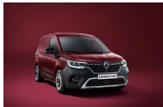
CARMINE RØD (NPF)