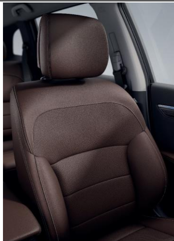
Standard INTENS + Setetrekk i siennabrunt Riviera-skinns*