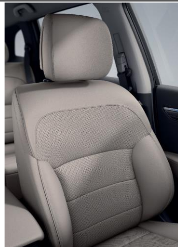
Standard INTENS +