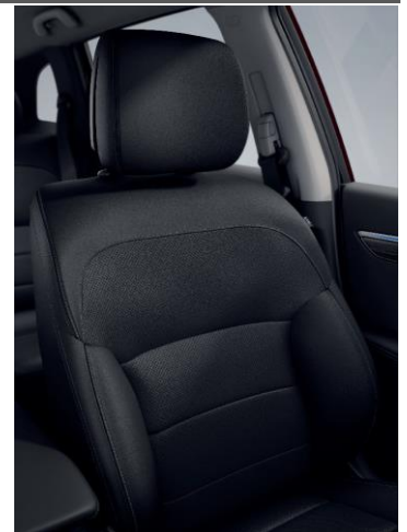
Standard INTENS +

*Kuskinns - (Setetrekkene er i skinn på fremre del av seteputene, seteryggen, hodestøttene og sidestøttene. De andre delene av setetrekkene er i impregnert tekstil.)