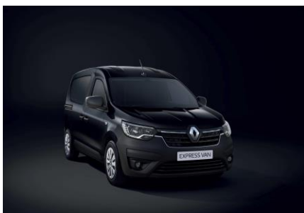
SORT "NACRE" (676)

Samtlige priser er anbefalte priser. Vi forbeholder oss retten til når som helst og uten forvarsel å kunne forandre gjeldende priser og spesifikasjoner.