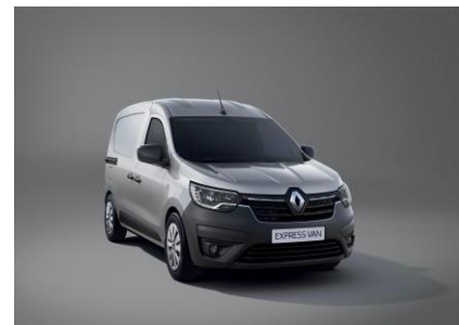
HIGHLAND GRÅ (KQA)