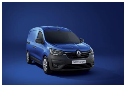
IRON BLUE (RQH)