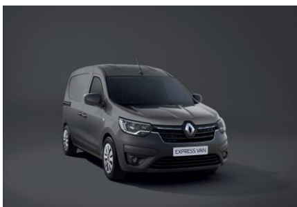
URBAN GRÅ (KPW)