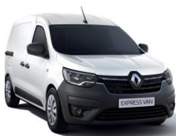
HVIT "GLACIER" (369)