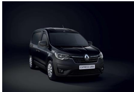
SORT "NACRE" (676)

Samtlige priser er anbefalte priser. Vi forbeholder oss retten til når som helst og uten forvarsel å kunne forandre gjeldende priser og spesifikasjoner.