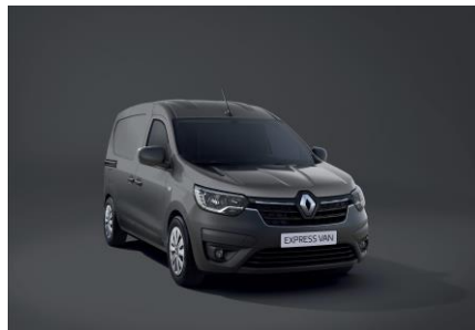
URBAN GRÅ (KPW)