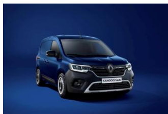
CANVASIT BLÅ (RQV)