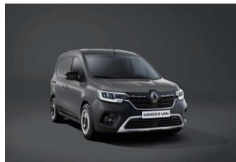
URBAN GRÅ (KPW)