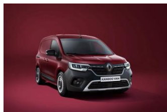
CARMINE RØD (NPF)