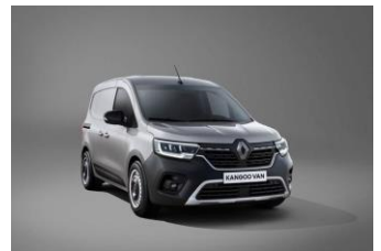
HIGHLAND GRÅ (KQA)