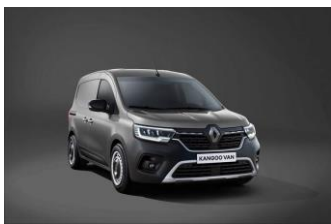
CASSIOPEE GRÅ (KNG)