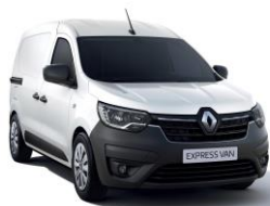
HVIT "GLACIER" (369)