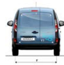
Kangoo Express Maxi og nye Kangoo Maxi Z.E.