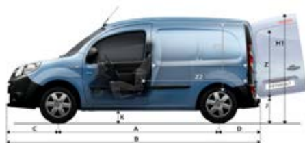
Kangoo Express og Kangoo Z.E.