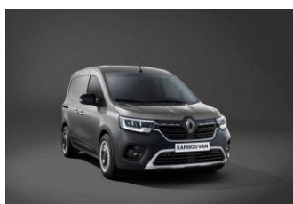
CASSIOPEE GRÅ [KNG]