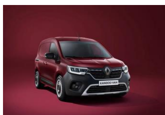
CARMINE RØD (NPF)