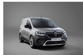
HIGHLAND GRÅ (KQA)