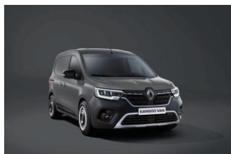
URBAN GRÅ (KPW)