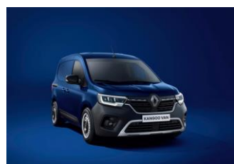
CANVASIT BLÅ [RQV]